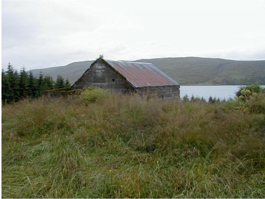
Mynd 3. Fjóshlaða. Eina uppistandandi byggingin á jörðinni.