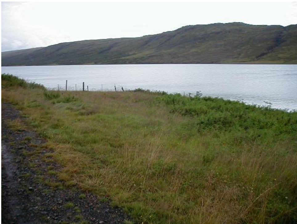
Mynd 8. Markeyri.