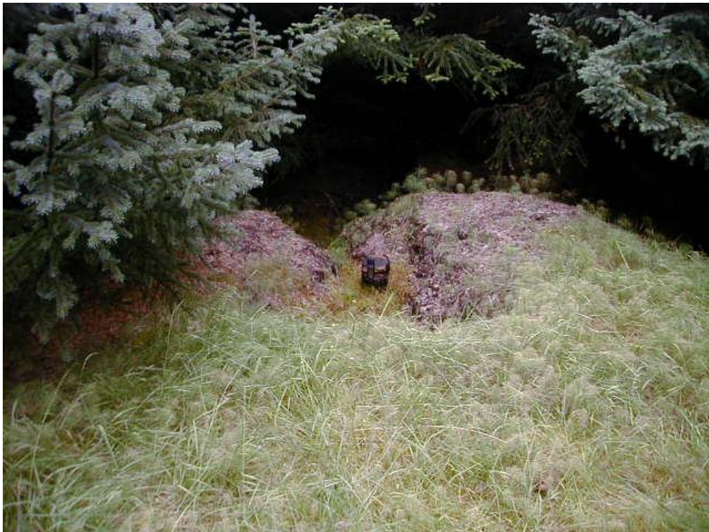
Mynd 6. Óþekkt rúst.

Ofar í hlíðinni og vestar er lítil rúst sem erfitt er að greina vegna þess hve þéttur skógurinn er, en hún gæti verið útihús sem kemur fram á túnkorti. GPS hnit á henni eru: N 64°31.317 & V 21°26.465.