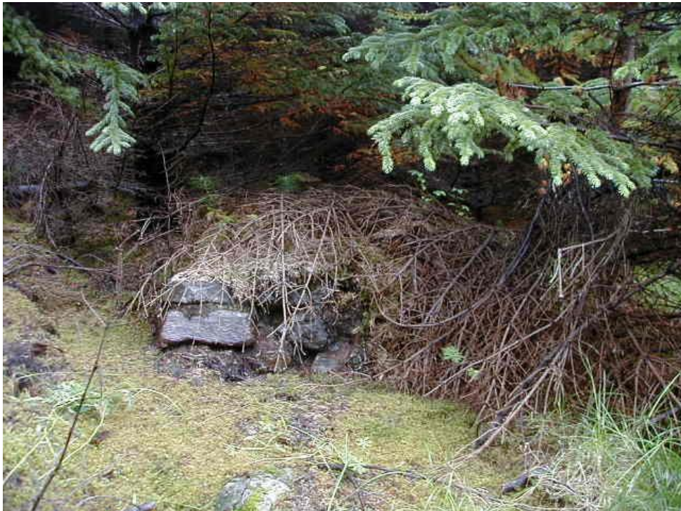
Mynd 7. Steinhleðsla, líklegast undirstaða vörðu.

Inn á milli trjáanna rakst ég einnig á hleðslu sem erfitt er að átta sig á en er lílegast leifar af vörðu. GPS hnit á henni eru: N 64°31.314 & V 21°26.504.