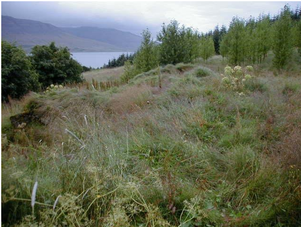
Mynd 4. Rústirnar austanmegin við fjóshlöðuna.

Ofan við þessar rústir er stór slétt flöt þar sem skógræktin er með hugmyndir um einhverjar framkvæmdir. Ofan við þessa flöt er skógarjaðarinn. Rétt innan við hann er mannvirki sem virðist vera túngarður. GPS hnit á honum eru: N 64°31.324 & V 21°26.457.