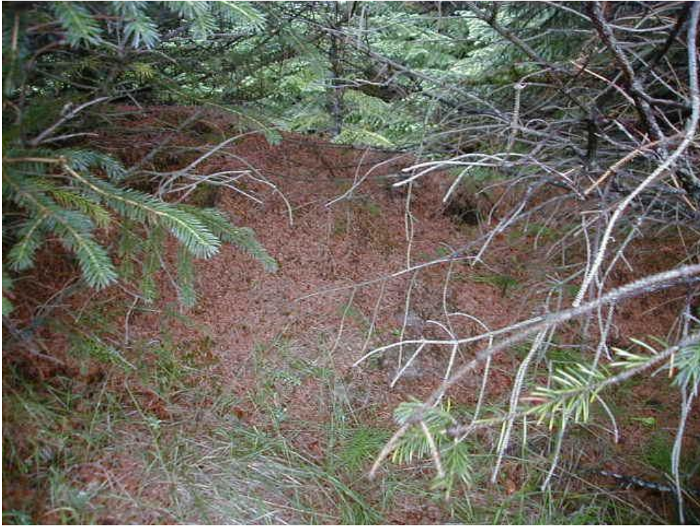
Mynd 5. Túngarður inní skógarjaðrinum.

Ofar í hlíðinni og vestar er lítil rúst sem erfitt er að greina vegna þess hve þéttur skógurinn er, en hún gæti verið útihús sem kemur fram á túnkorti. GPS hnit á henni eru: N 64°31.317 & V 21°26.465.