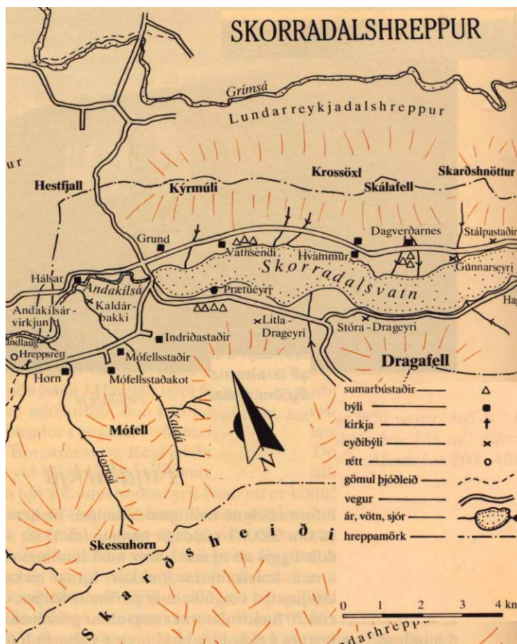
Mynd 2. Afstöðumynd af Stálpastaðum. (Byggðir Borgarfjarðar II: 220-221.)