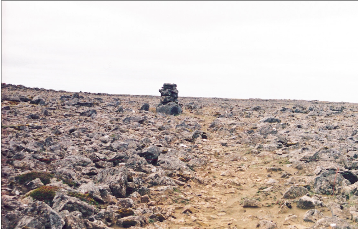
Mynd 14. Varða við Kaupstaðaveg / Cairn by Township Trail B-182395-40-30.

en ekkert verður fullyrt um hvort hún sé hin sama og nefnd er í örnefnalýsingunni. Hún kann að tilheyra kaupstaðaleiðinni (B-182395-40-37).