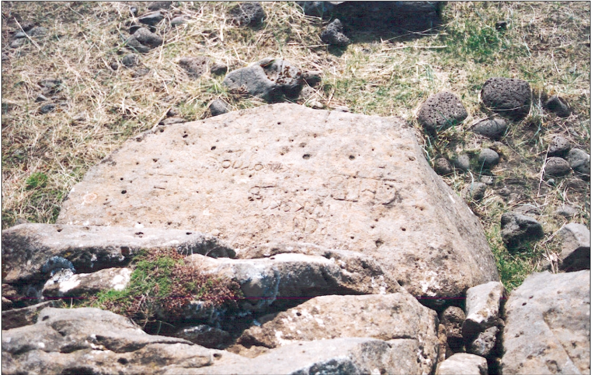
Mynd 6. Fangamörk við Þórshöfn / Inscriptions by Þórshöfn S-181039-40-5.