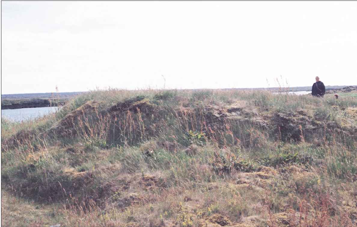
Mynd 17. Bæjarhóllinn á Kirkjuvogi / Farm hillock in Kirkjuvogur K-181033-35-1.

Íslenskir annálar sive Annales Islandicum ab anno christi 803 ad annum 1430, 1847. Bls. 236, 238.