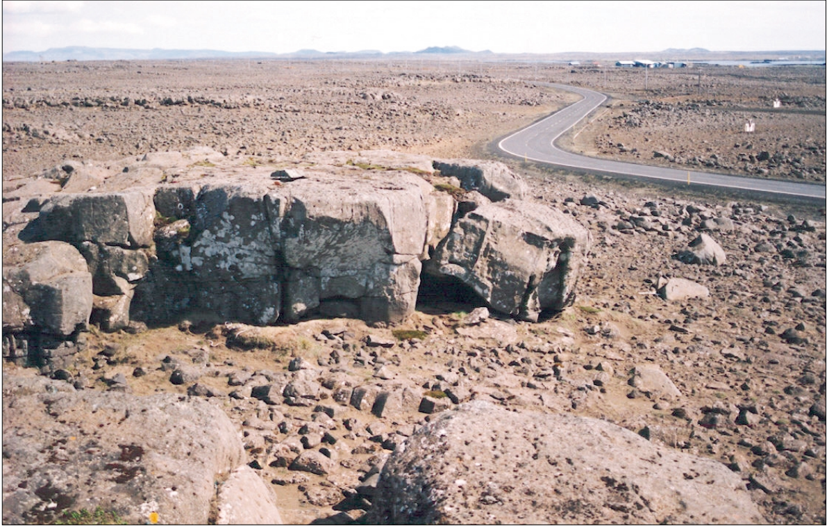
Mynd 5. Gálgaklettur / Hanging Rocks S-181039-40-1.