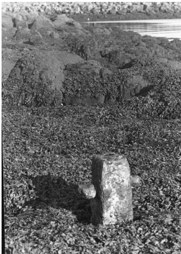
Mynd 10. Festarhringur á Básendum / Fastening Ring at Básendar B-182395-40-2.