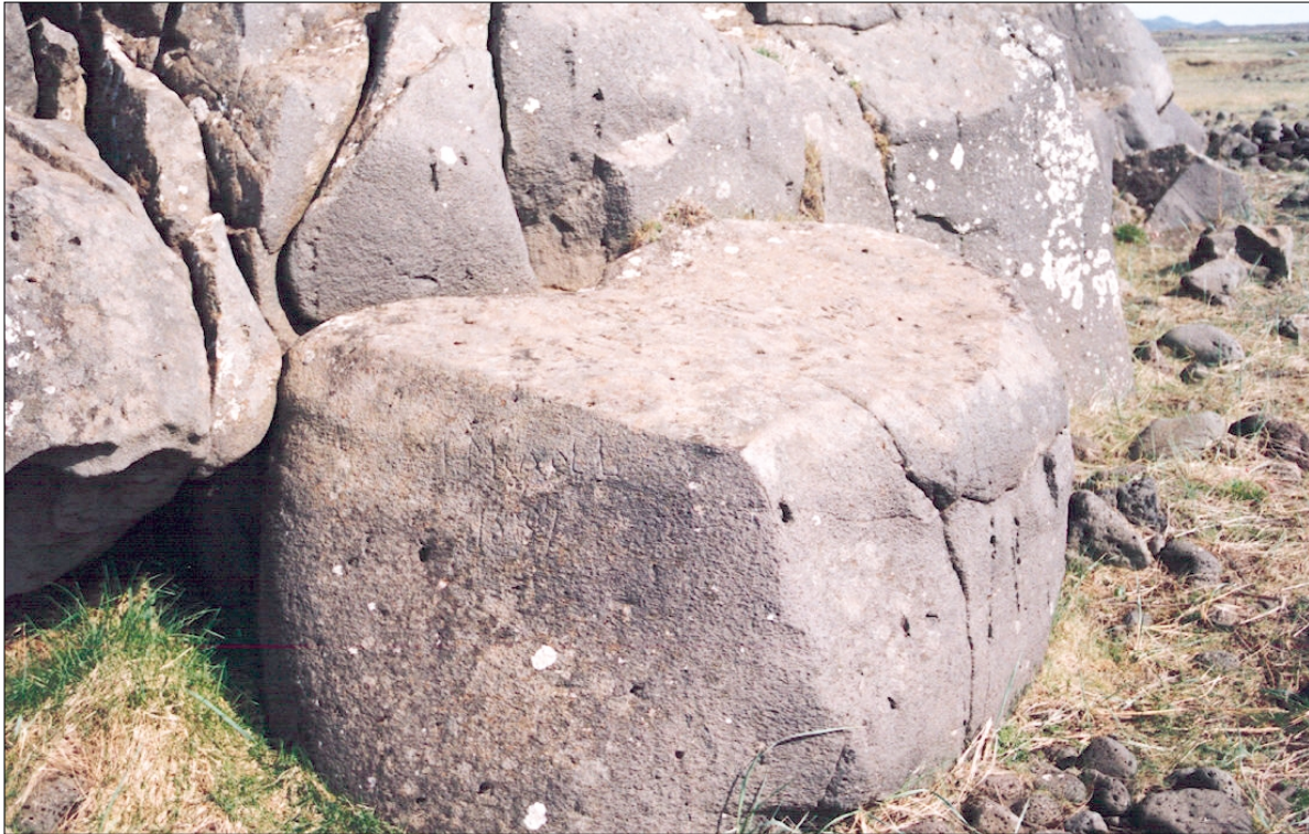
Mynd 7. Fangamörk við Þórshöfn / Inscriptions by Þórshöfn S-181039-40-5.