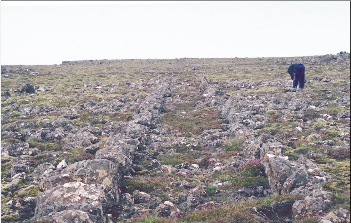
Mynd 13. Kaupstaðavegur / Township Trail B-182395-40-30.