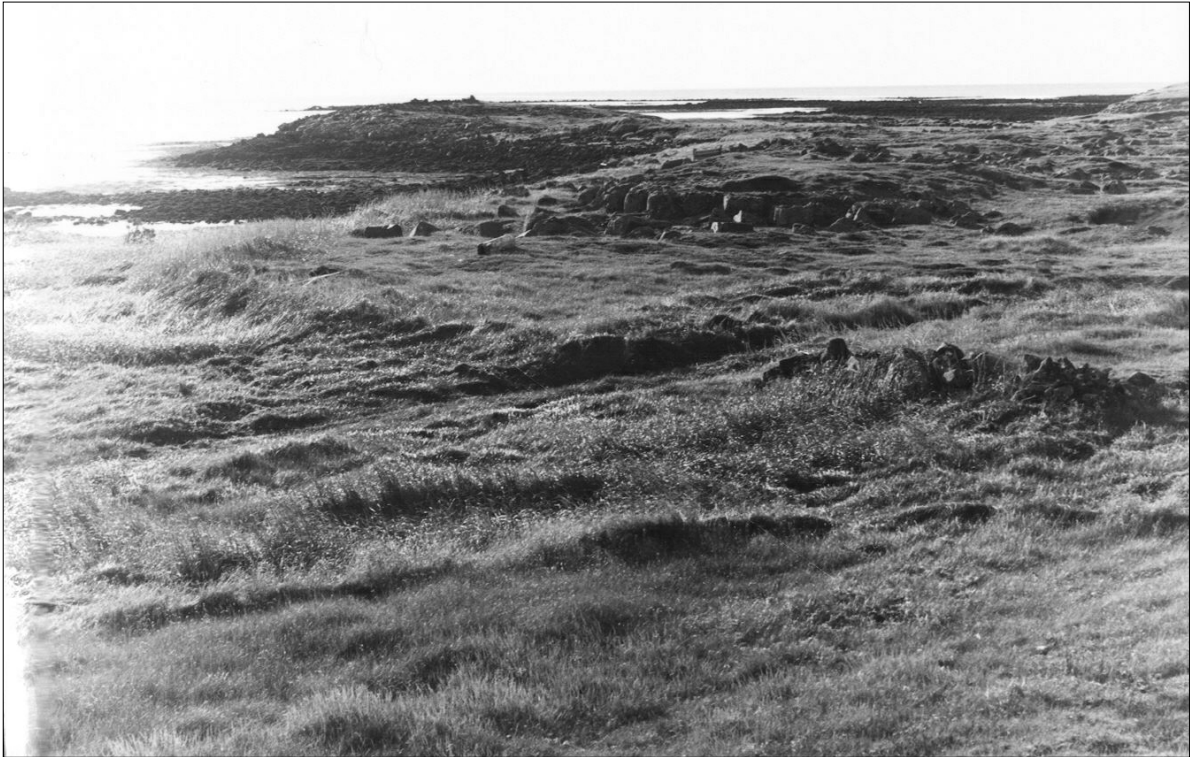
Mynd 8. Básendar / Básendar. (PM)