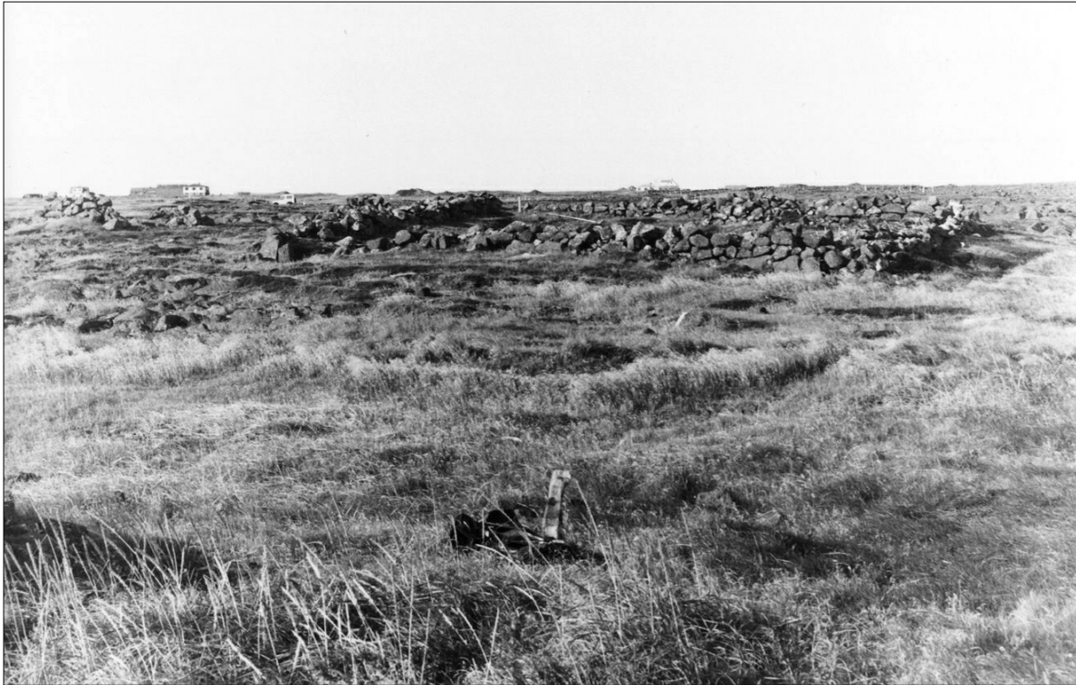
Mynd 12. Rétt og útihús á Básendum / Corral and animal sheds at Básendar B-182395-40-18/19.

árla morguns 9. janúar 1799 þegar sjórinn var að mola undan þeim íbúðarhúsið (B-182395-40-8) í Básendaflóðinu: „Eg vóð með yngsta barnið á handleggnum, þar sem sjórinn flæddi yfir og skolaði með sér borðum, plönkum, fjármunum og búshlutum. Náðum þó fjósinu með mestu erfiðismunum og lífshættu. Fjósið stendur svolítið hærra og fjær sjónum en íbúðarhúsið. En tæplega höfðum við dvalið þar fjórðung stundar, þegar mæniásinn brast í fjósinu. Við urðum því að flýja þaðan aptur.“