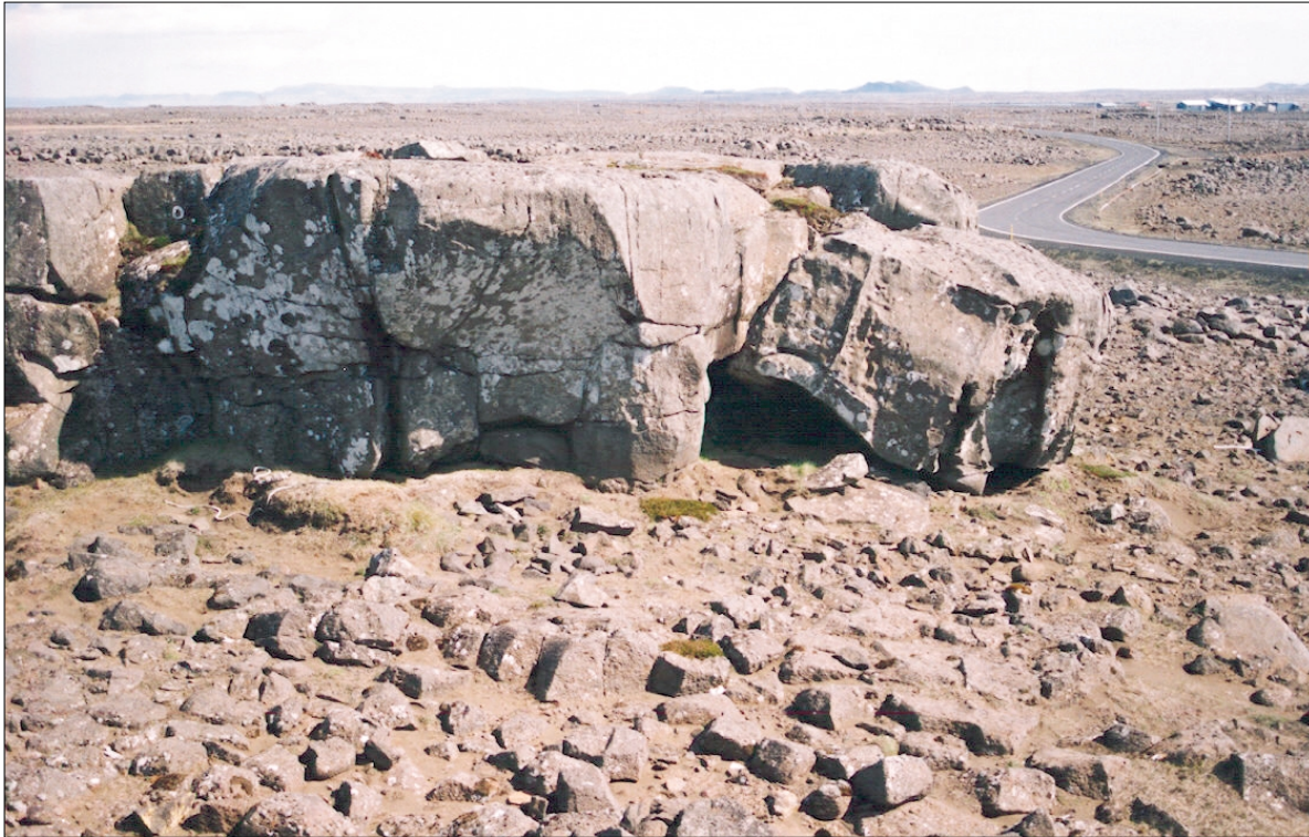
Mynd 4. Gálgaklettur / Hanging Rocks S-181039-40-1.

A öldum áður var þó útræði mikið og hófst konungsútgerð á Stafnesi um miðja 16. öld og stóð til 1769. Voru landsetar af konungsjörðum suðvestanlands skyldugir að róa á árabátum þaðan fyrir harla lítil laun. Á 17. og 18. öld var Stafnes fjölmennasta verstöð á Suðurnesjum. Töluverð selveiði var á Stafnesi fyrr á árum. 11 Stafnes er í fornum máldögum oftast kallað Starnes. Ef það er upprunalegt nafn bæjarins bendir það til þess að þar hafi verið starengi. Þá er líklegast að það sé komið undir sjó. 12 Hrjóstrugt er umhverfis Stafnes, einkum í heiðinni ofan við byggðina. Hefur jarðvegur fokið burt og er nú aðeins bert grjótið eftir. Samhliða þessu hefur sjór gengið mjög á landið, enda bera skerjaflákar undan ströndinni þess merki. Mörg skip hafa farist á Stafnesskerjum. 13 Árið 1928 fórst þar togarinn Jón forseti. Drukknuðu 15 skipverjar en 10 varð bjargað. 14 Annað botnvörpuskip, Admiral Toco, strandaði þar í foráttu brimi árið 1913 og fórust allir með því. 15