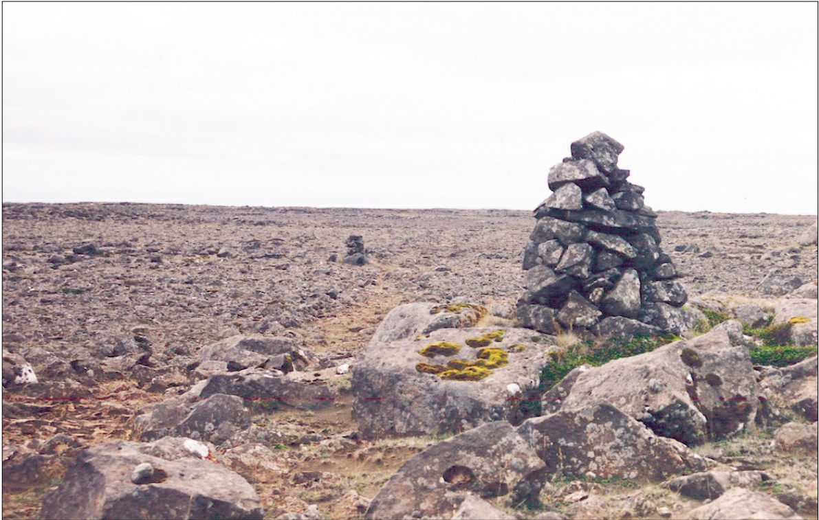
Mynd 15. Vörður við Kaupstaðaveg / Cairns by Township Trail B-182395-40-30.