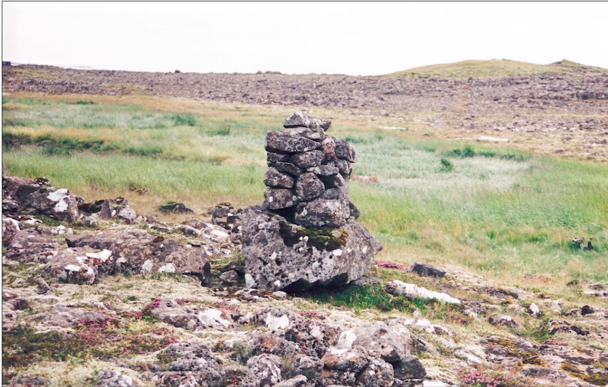
Mynd 16. Varða við Kaupstaðaveg / Cairn by Township Trail B-182395-40-30.

[B-182395-40-28] og Draughólskampur með sjó fram til suðurs, fram af kampi þessum er stór kletthólmi úti í sjó, heitir hann Arnbjarnarhólmi. Þar eru suðurmörk Básendahafnar [B-182395-40-1].“