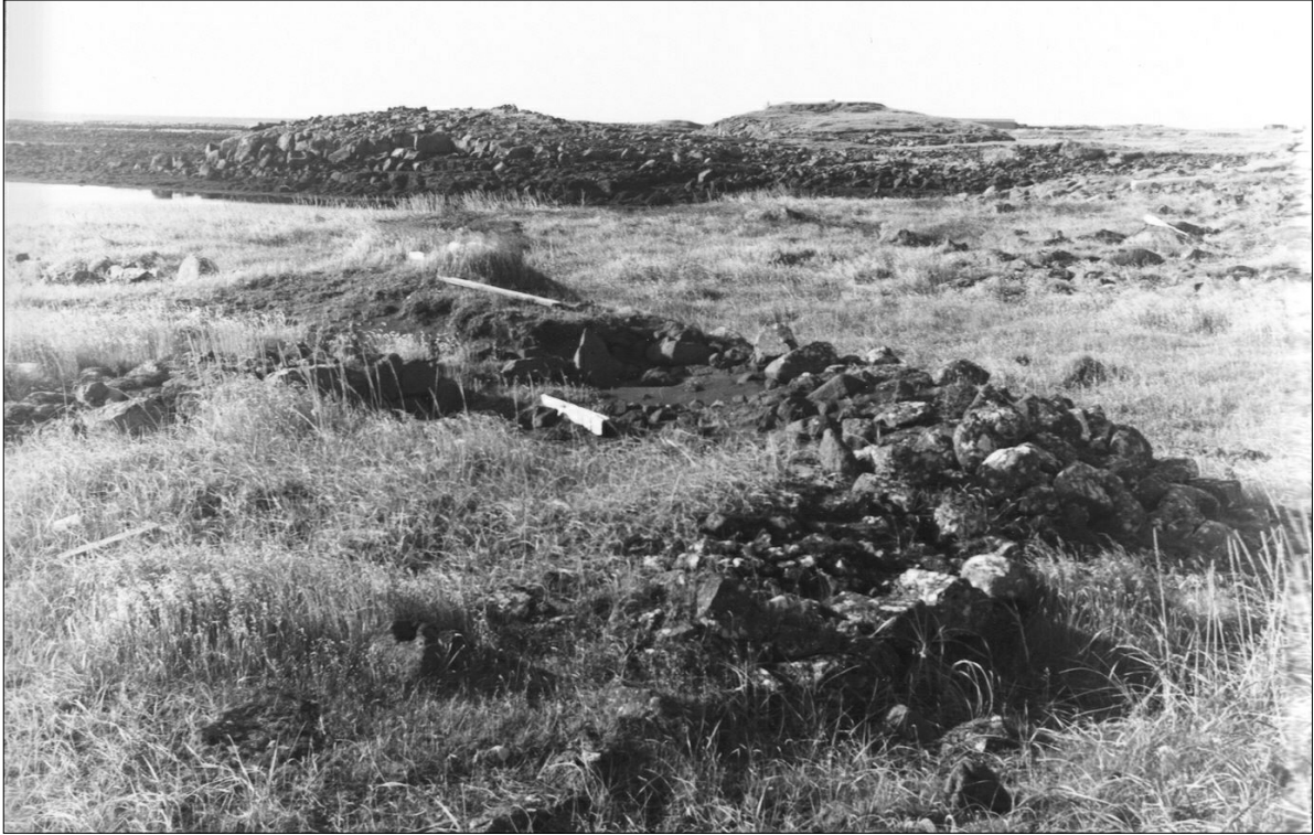
Mynd 11. Tóftir á Básendum / Ruins at Básendar B-182395-40-10/11/12.

mannvirkja (sjá nr. B-182395-40-10 til B-182395-40-12 auk B-182395-40-14) sem ekki er vitað hvaða tilgang höfðu, svo illa voru þau farin. Meðal þeirra kunna fátæklegar leifar lýsibúðarinnar að vera, þó tæplega B-182395-40-14 því að þar virðist vera meira varðveitt en lýsing af lýsibúðinni gefur til kynna. Um þetta verður þó ekkert fullyrt.