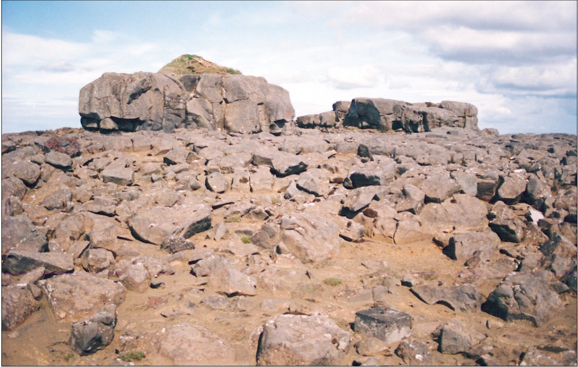
Mynd 3. Gálgaklettur / Hanging Rocks S-181039-40-1. (GÓL)