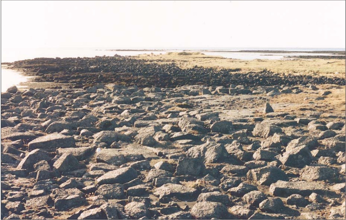
Mynd 1. Horft yfir Bäsendarkaupstað. / Remains of Bäsendar trading station (GÓL).

ar ábendingar um landamerki og heimildir.