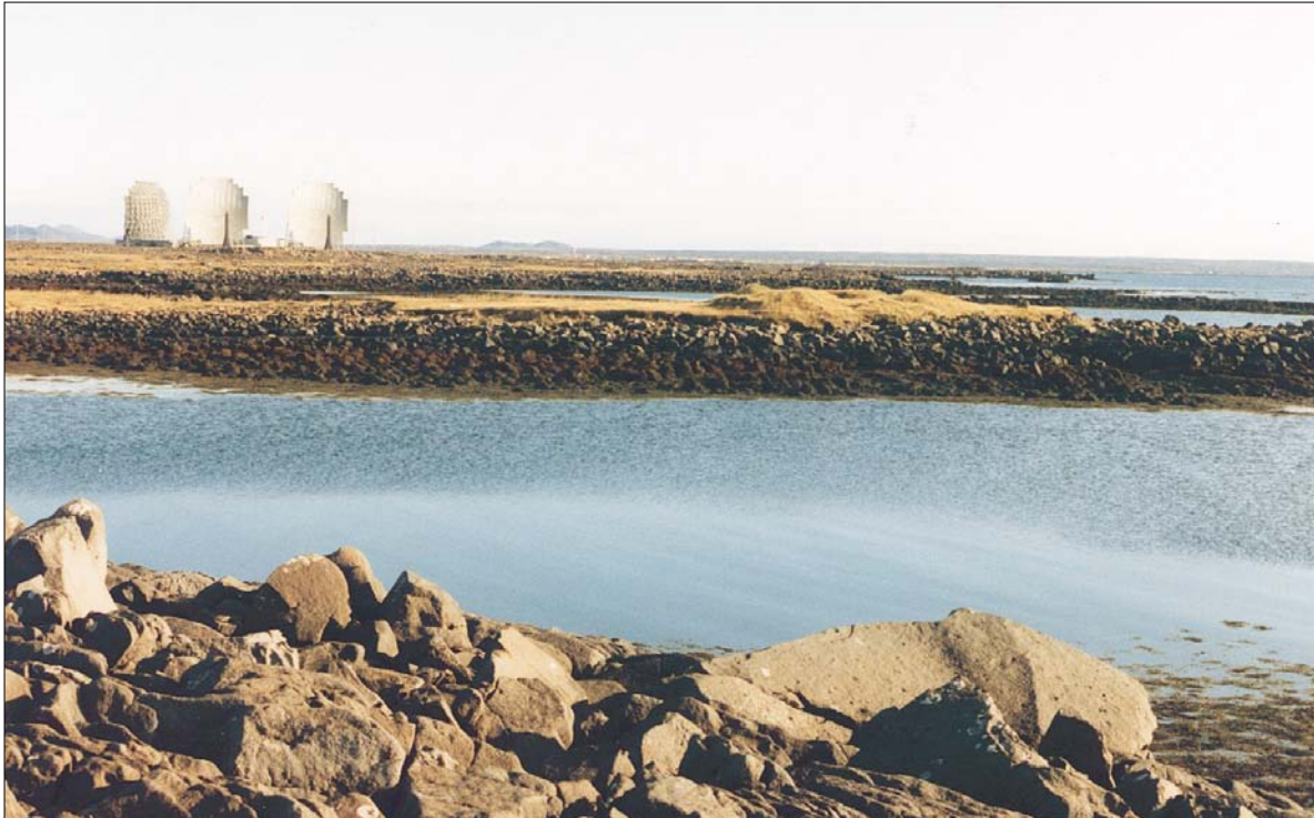
Mynd 2. Básendar. Bæjarhóllinn B-182395-40-5 er hægra megin við miðju á myndinni. Vör B-182395-40-1 sést í fjörunni neðan við hann til hægri. Ratsjárskermar í bakssýn. / Básendar. The farm stead is to the right. A narrow landing place is further to the right.

sameinar þess vegna hagsmuni fræðigreinarinnar og þeirra sem standa að framkvæmdum.