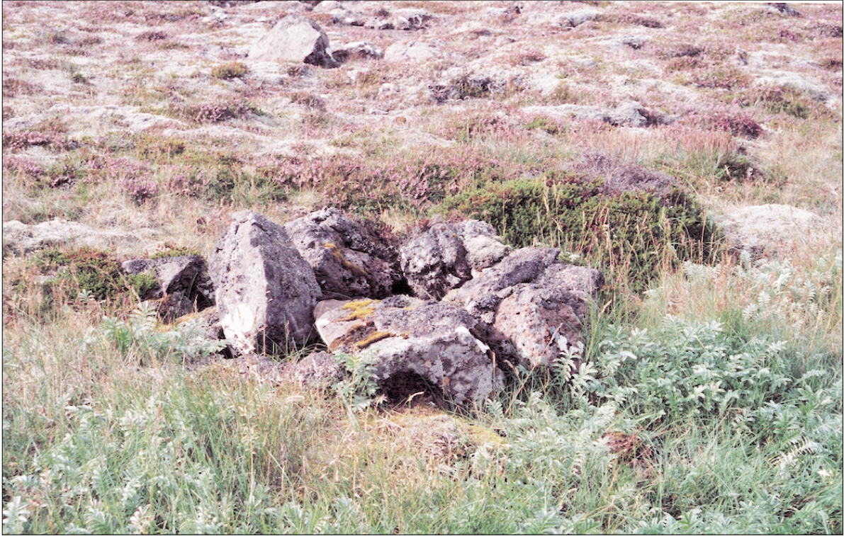
Mynd 18. Brunnur við Kirkjuvog / Well by Kirkjuvogur K-181033-35-2.