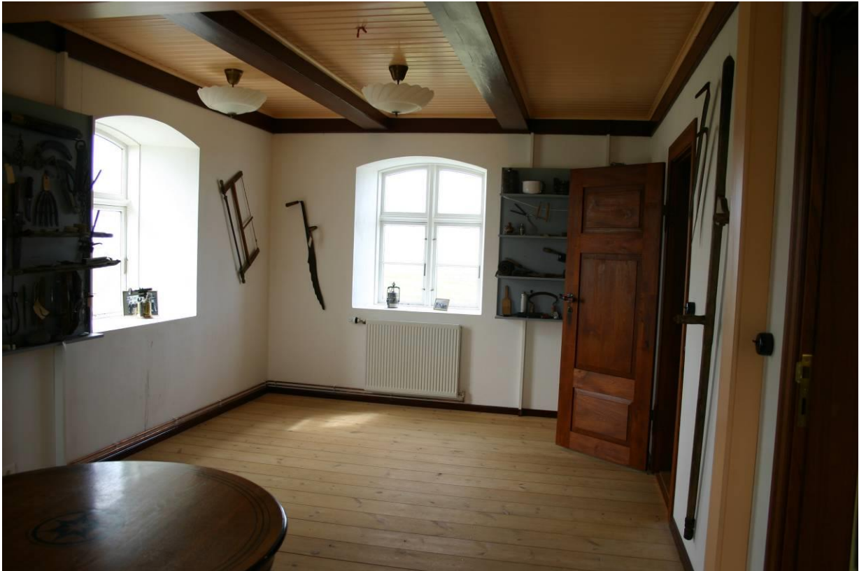
Prestsetrið á Sandanesi, stofa við suðurgöfl. GLH 2005.

er í norðausturhorni og stigi upp á jarðæð, eldhús fyrir miðri austurhlið, kompa í suðausturhorni, stofa