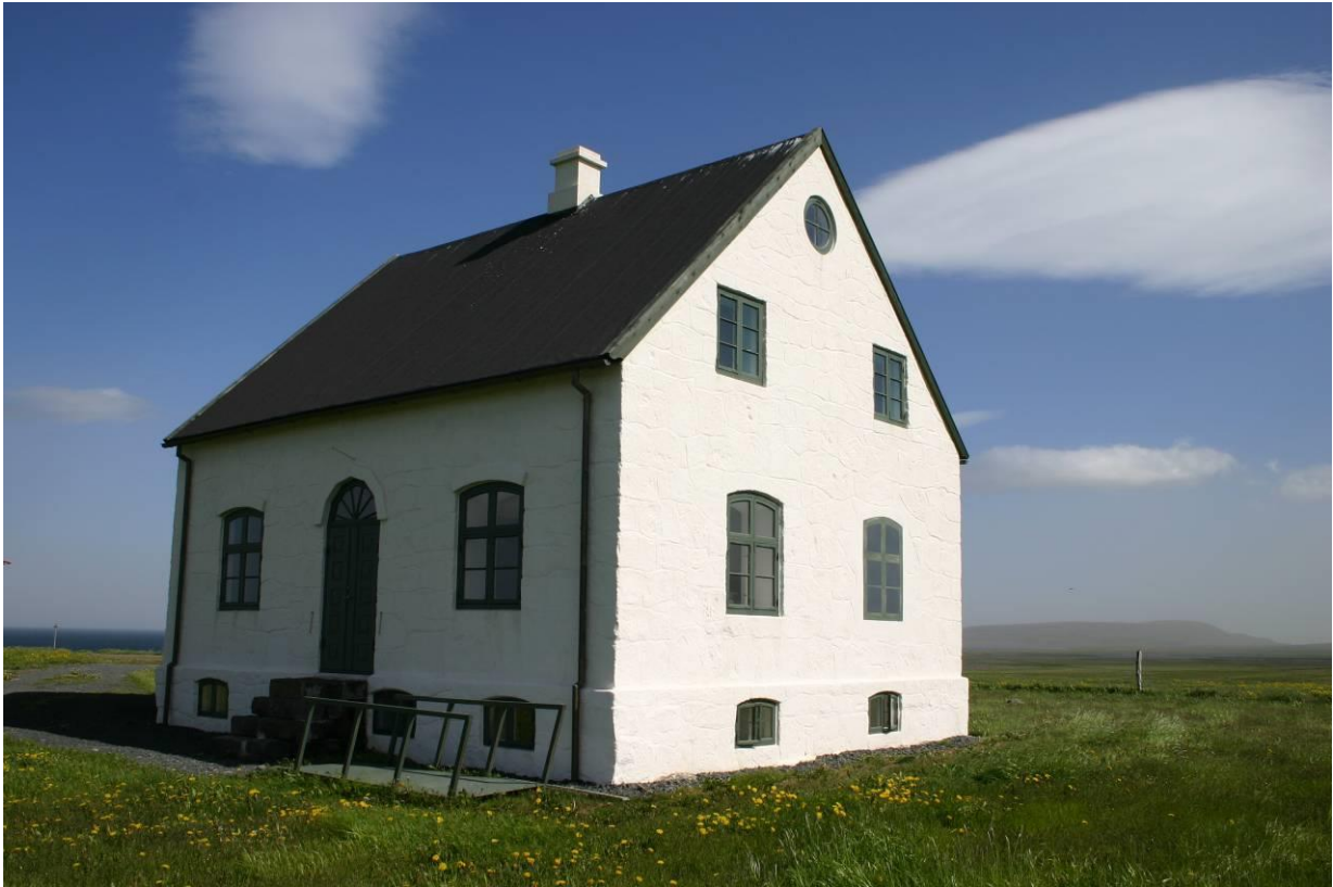
Prestsetrið á Sauðanesi. GLH 2005.