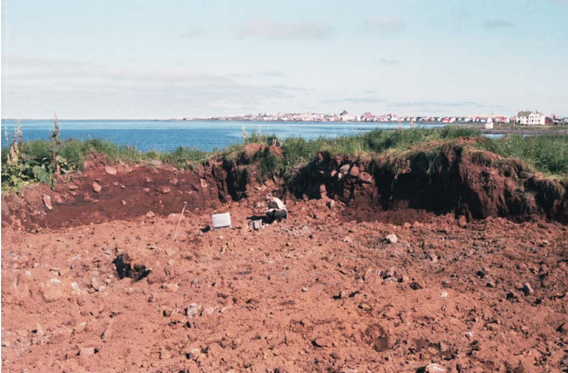
Horft til norðurs yfir húsgrunninn. Sjá má leifar af hleðslum í sniðbökkum. (GÓL 9121-9). Seltjarnarnes er í baksýn.