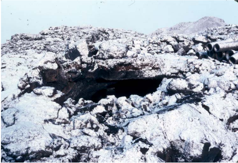
Mynd 2. Snævi þakið hraun umhverfis op hrauhellisins (GÓL-1982-7-3).

Þar eð syðsti hluti aðalhellisins hafði hrunið niður og hugsanleg að undir ruðningunum væri að finna frekari verksummerki um hellisbúa, reyndist nauðsynlegt að koma síðar og kanna svæðið betur.