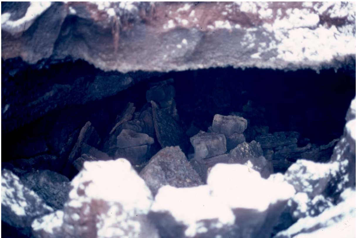
Mynd 3. Horft inn í hellinn. Leifar af hellum og hleðslugrjóti fyrir miðju (GÓL-1982-4).

Þann 24. nóvember var aftur komið á staðinn og þá var allt lausagrjót fjarlægt með hjálp starfsmanna Hitaveitu Suðurnesja. Varð afrakstur þeirrar rannsóknar þó ekki ýkja mikill. Engar frekari hleðslur komu í ljós umfram þær sem fundnar voru eða annað það sem upplýst gæti frekar um hver eða hverjir hefðu hafst við í helli þessum.