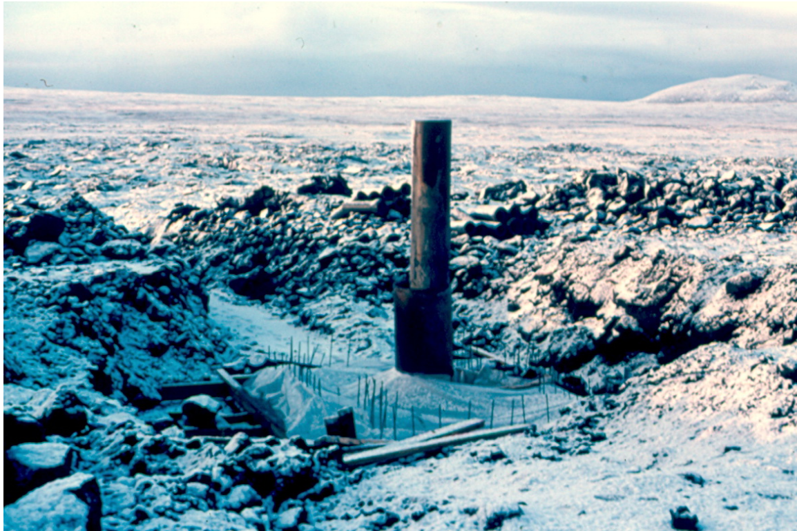
Mynd 1 Borhola EH-1 í við Eldvörp. Hellirinn er á bak við ruðninginn (GÓL-1982-7-1).