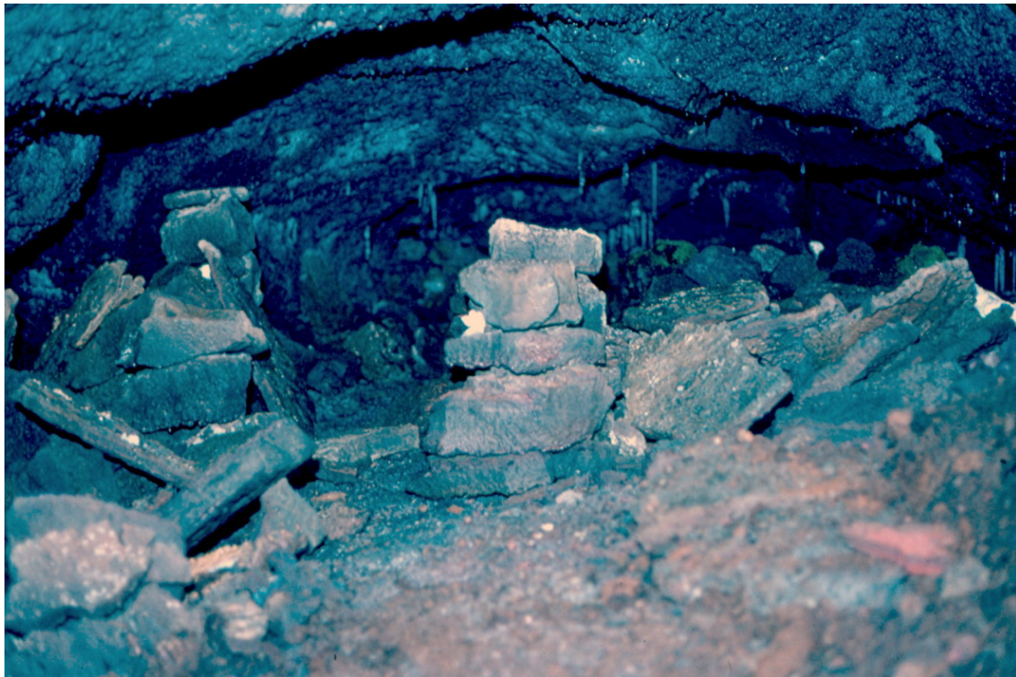
Mynd 5. Tvær steinaraðir, með fjórum til fimm lögum af steinum, eru til vinstri á myndinni. Til hægri eru hraunhellur sem raðað hafði verið upp á rönd. Fremst á myndinni sjást nokkrar beinaleifar sem hvítir blettir, vegna myglusveppa sem á þeim hafa myndast (GÓL-1982-7-10).

Jarðýta hafði brotið niður syðsta hluta aðalhellisins og var hann þar fullur af hraunhellum sem hrunið höfðu úr þakinu. Nálægt miðju var manngert op í þakinu, um hálfur metri í þvermál. Upp í það hafði verið hlaðið grjóti að utanverðu. Frágangur var þannig að utanfrá séð var ekki hægt að greina að hellir væri þar undir, nema fyrir þann sem vissi af honum.