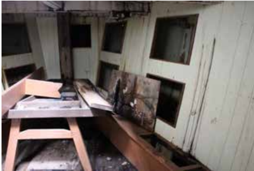
Undir þiljum í Sigurfara, 2017. Fremsta rýmið, lúkarinn.