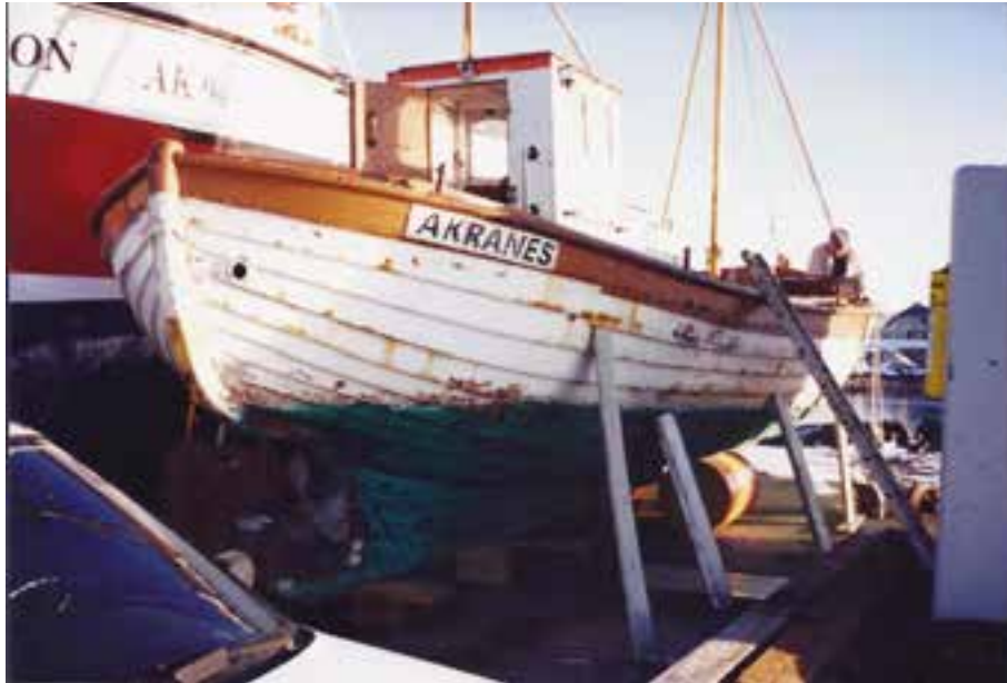
Sigursæll AK 87 í slipp árið 1995.