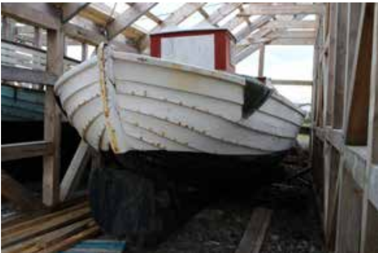
Sæljón AK 24 í nýja bátakýlinu, 2017.