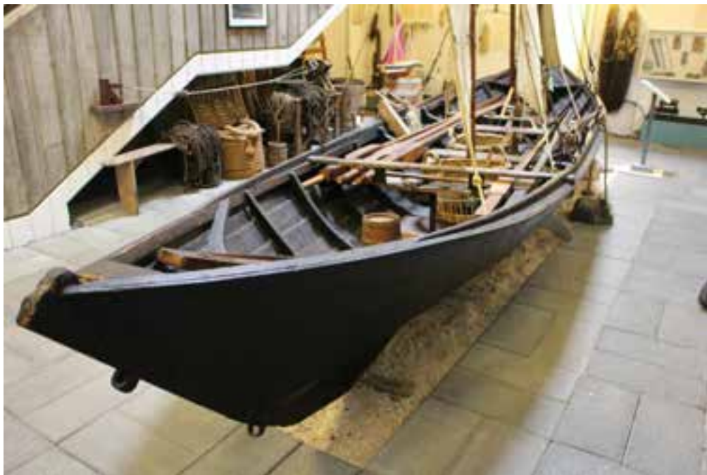
Sæunn MB 9 á sýningu Byggðasafnsins, 2017.