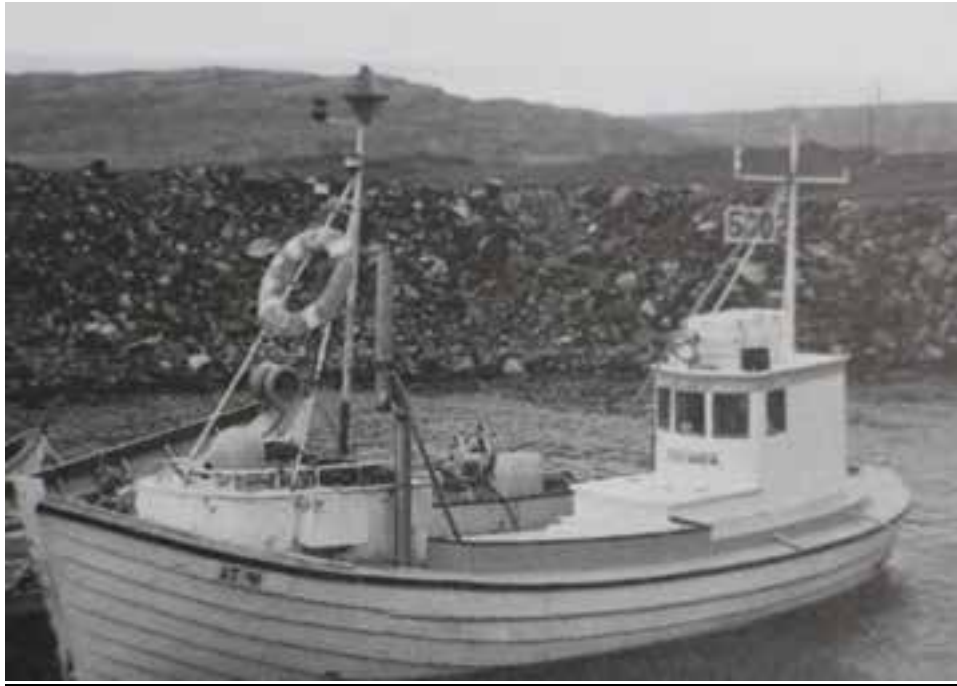
Smári SI 35, þ.e. Stefanía ST 91, á floti.