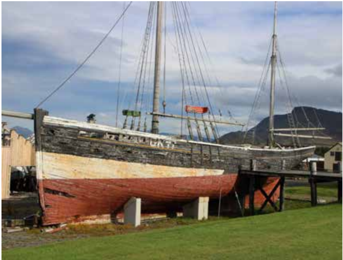
Sigurfari GK 17 á safnlóð Byggðasafnsins í Görðum, 2017.