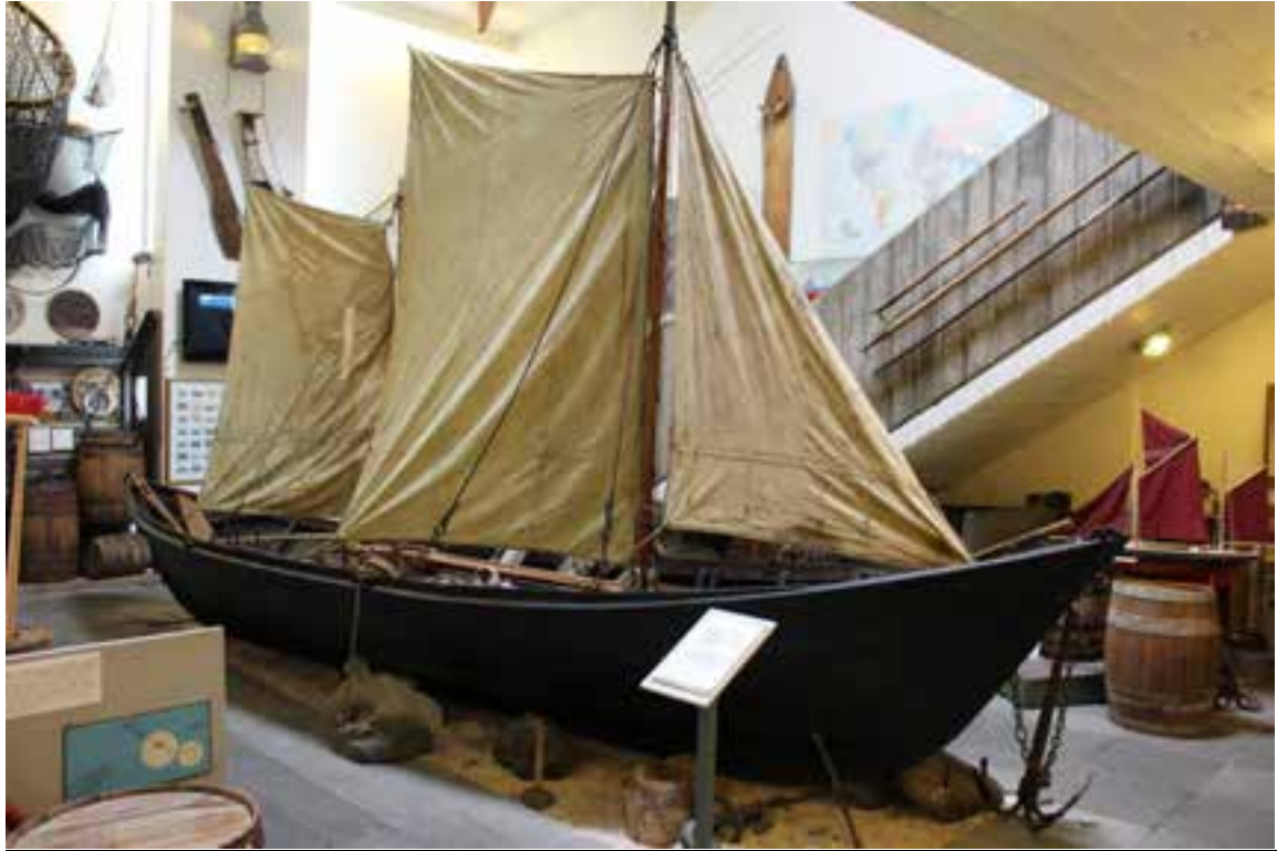
Sæunn MB 9 á sýningu Byggðasafnsins í Görðum, 2017.