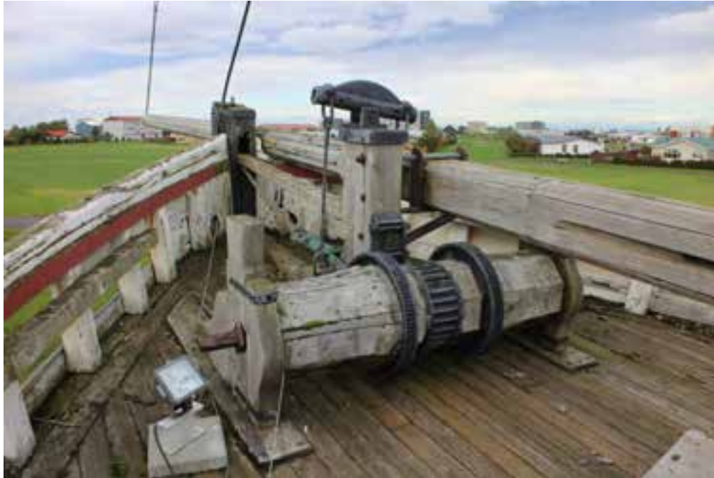
Af dekki Sigurfara, 2017. Framstefnið og akkerisvinda.

Skipið hefur verið endurgert að miklum hluta og lítið er eftir af upprunalegum efnivið. Ástand skipsins er bágborið. 21