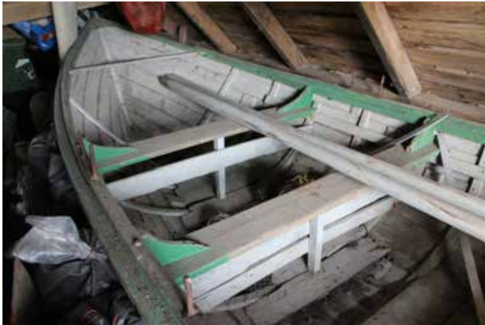
Bátur Péturs Sigurbjörnssonar, í geymsluhúsi í Görðum, 2017.

Gott eintak, vel með farið, sennilega nokkurn veginn eins og báturinn var upprunalega.