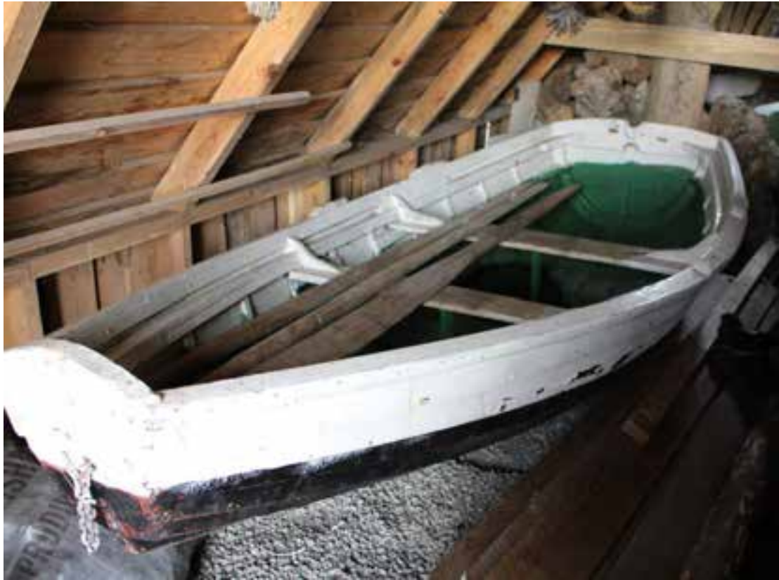
Prammi, í geymsluhúsi í Görðum, 2017.