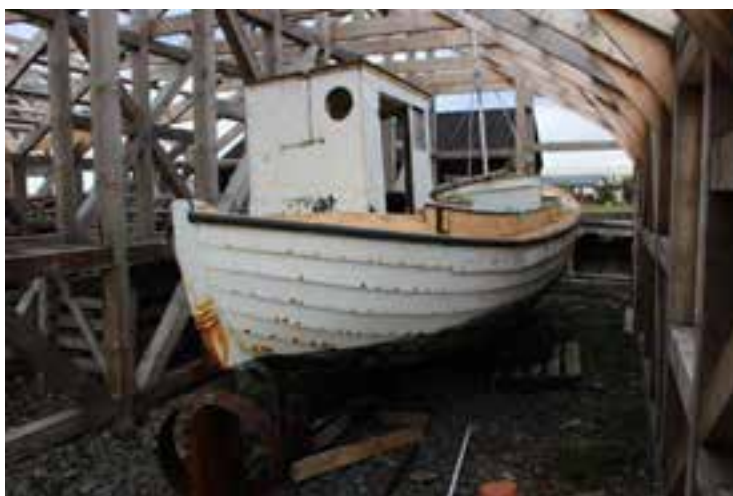
Smári SI 35, 2017, skutur.