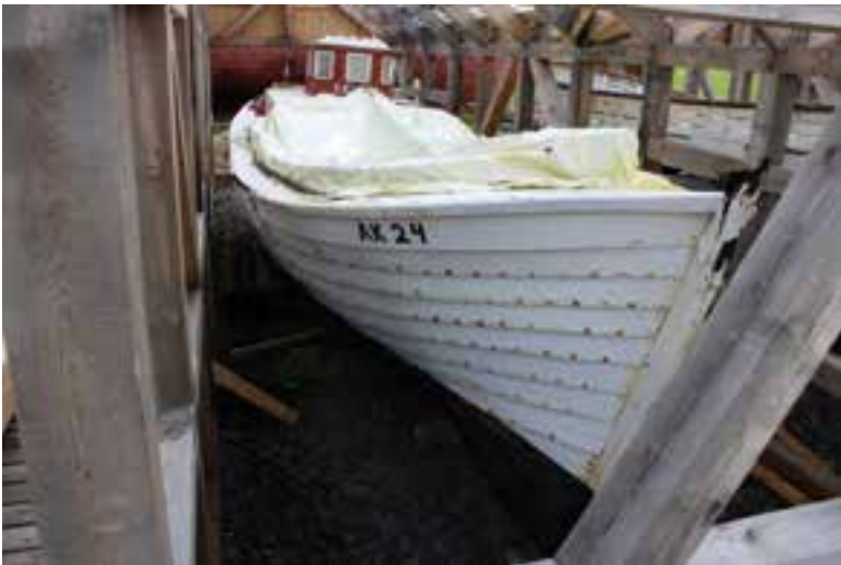
Sæljón AK 24 undir segli í nýja bátakýlinu, 2017.