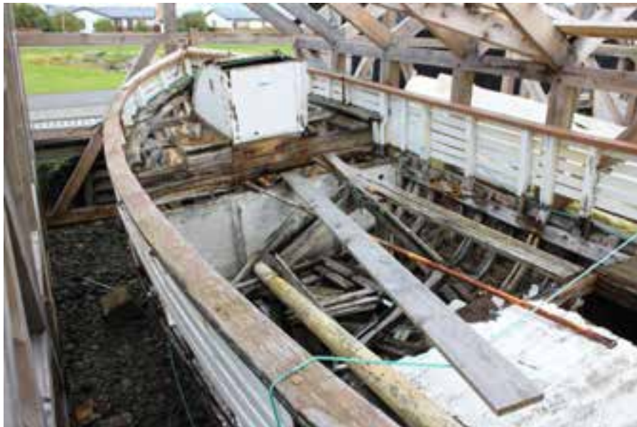
Síldin AK 88, 2017. Dekkið er horfið, aðallega vegna fúa.

Með hliðsjón af lélegu ástandi bátsins orkar etv. tvímælis að gera við hann, sbr. myndina hér fyrir neðan.