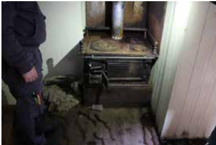
Undir þiljum í Sigurfara, 2017. Eldavélin í lúkarnum.