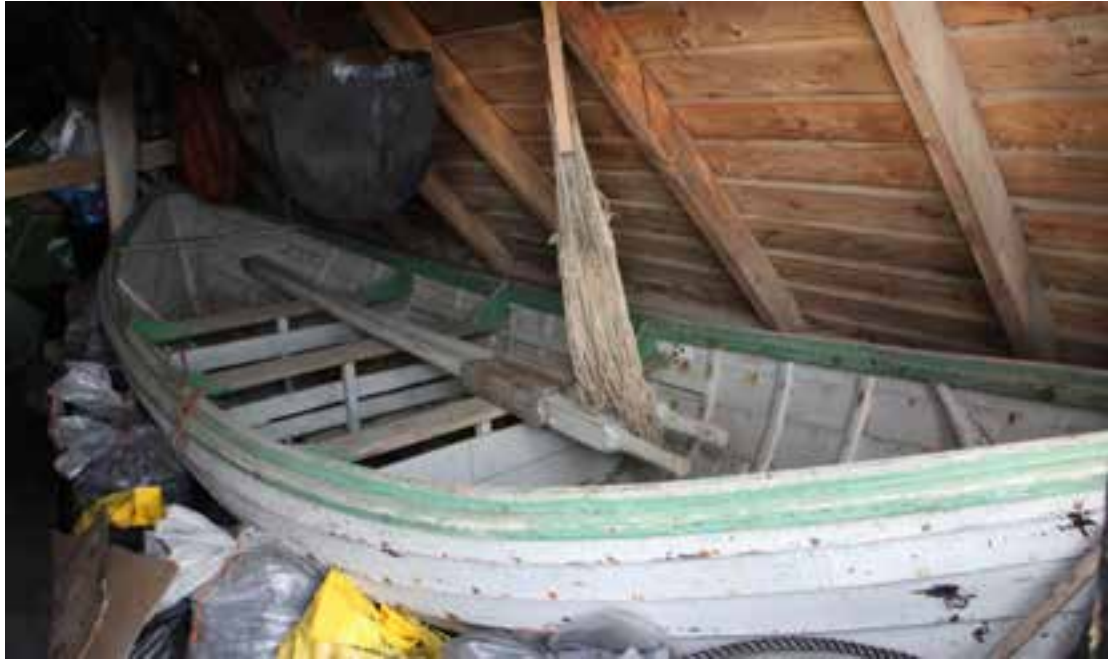
Bátur Péturs Sigurbjörnssonar í geymslu á Byggðasafninu í Görðum, 2017.