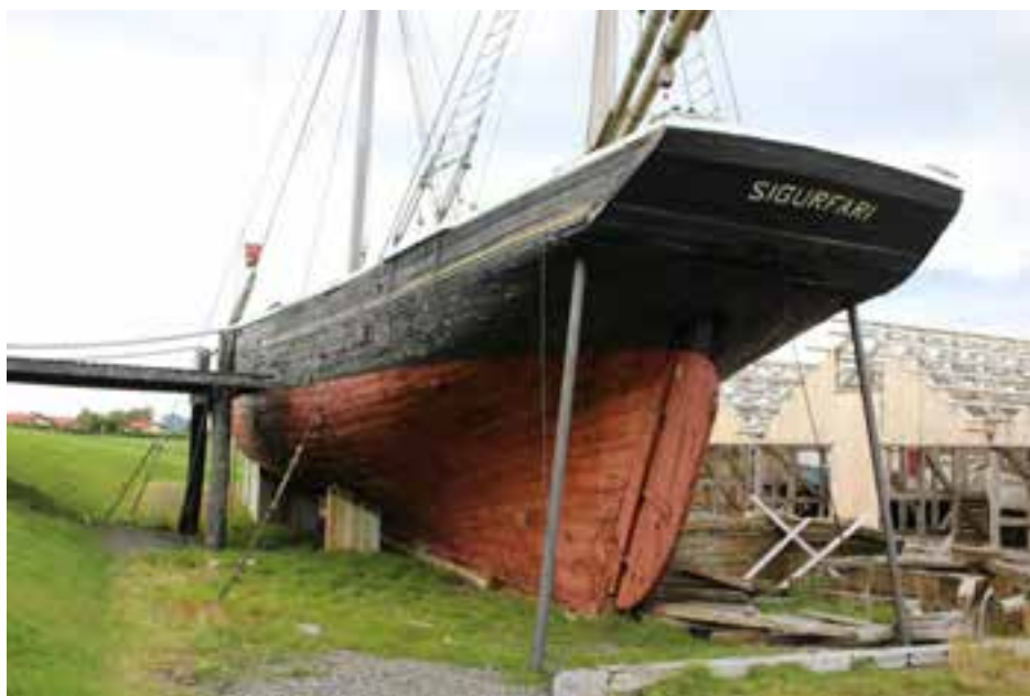
Sigurfari á safnlóð Byggðasafnsins, 2017.

Skipið var að mestu komið í sitt upprunalega horf á 100 ára afmæli þess sumarið 1985 þegar það var opnað formlega til sýnis. Þó vantaði nokkuð upp á að hægt væri að klára innréttingu í káetu, gerð og uppsetningu seglabúnaðar og fleira smálegt ofan þilja. 18