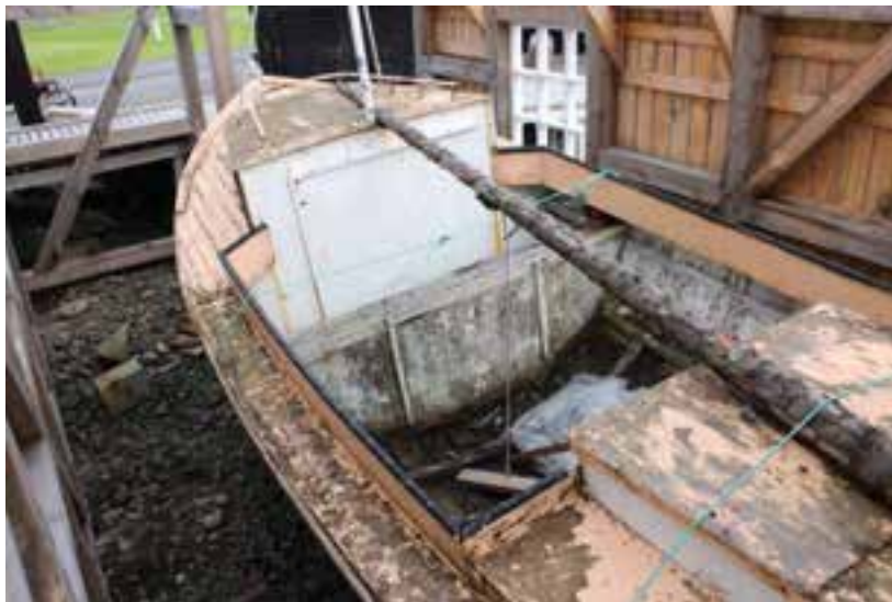
Smári SI 35, 2017, horft niður á hann.