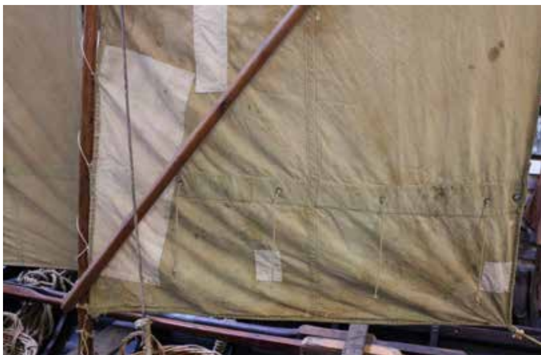
Segl á Sæunni MB 9 á sýningu Byggðasafnsins, 2017.