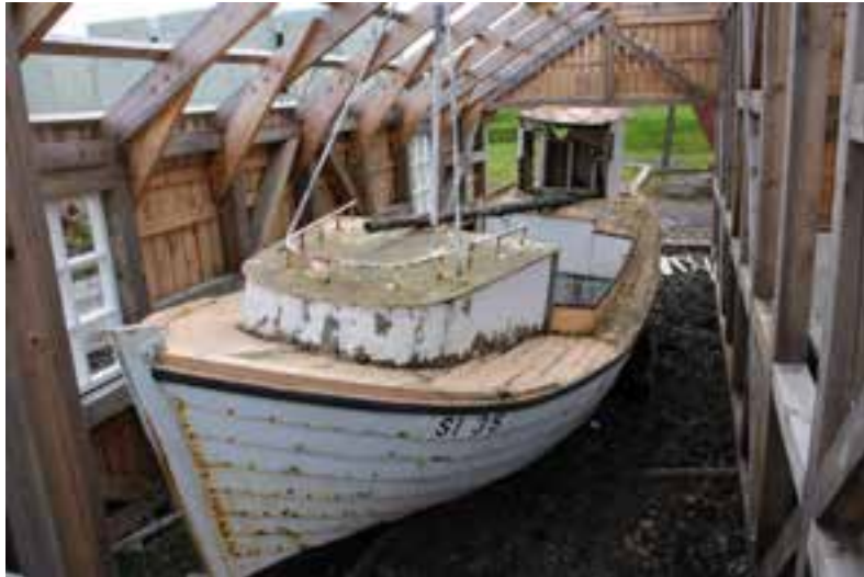
Smári SI 35 á leið í skjól í nýja bátahúsinu við Byggðasafnið í Görðum, 2017.