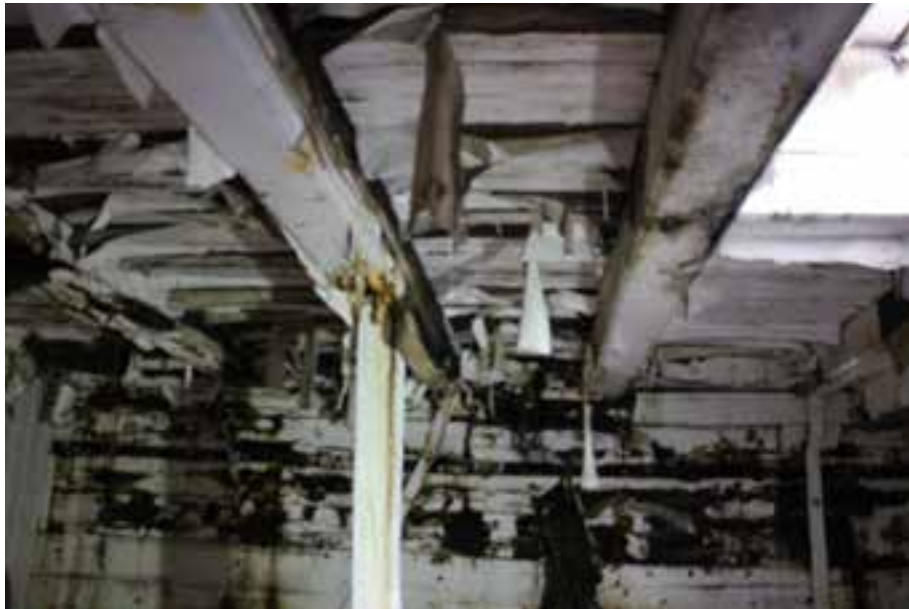
Undir þiljum í Sigurfara, 2017. Loftið í fiskilestinni. Laus málning hangir niður. Fiskilestin er stærsta rýmið neðan þilja og var notuð fyrir minni samkomur á tímabili.