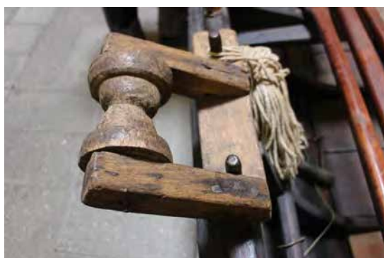
Handfærarúlla af gamalli gerð á Sæunni MB 9, 2017.

Byggðasafn Akraness eignaðist bátinn árið 1958 og er hann til sýnis þar.