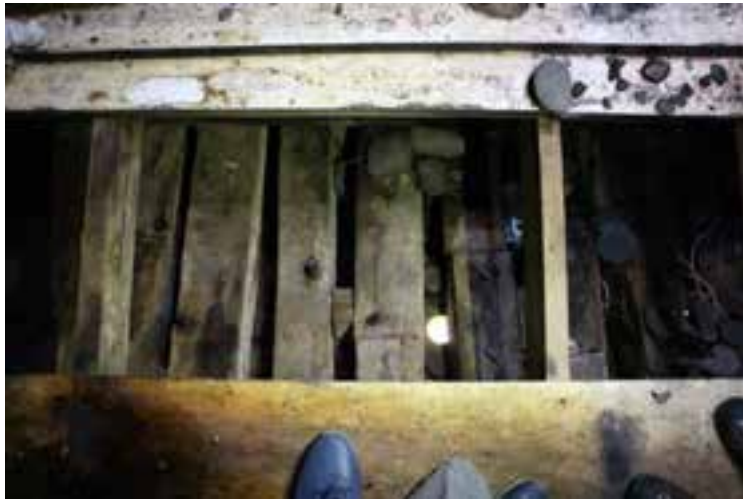
Undir þiljum í Sigurfara, 2017. Böndin á botninum eru svo þétt, að þau eru nálægt því að snertast sumstaðar.