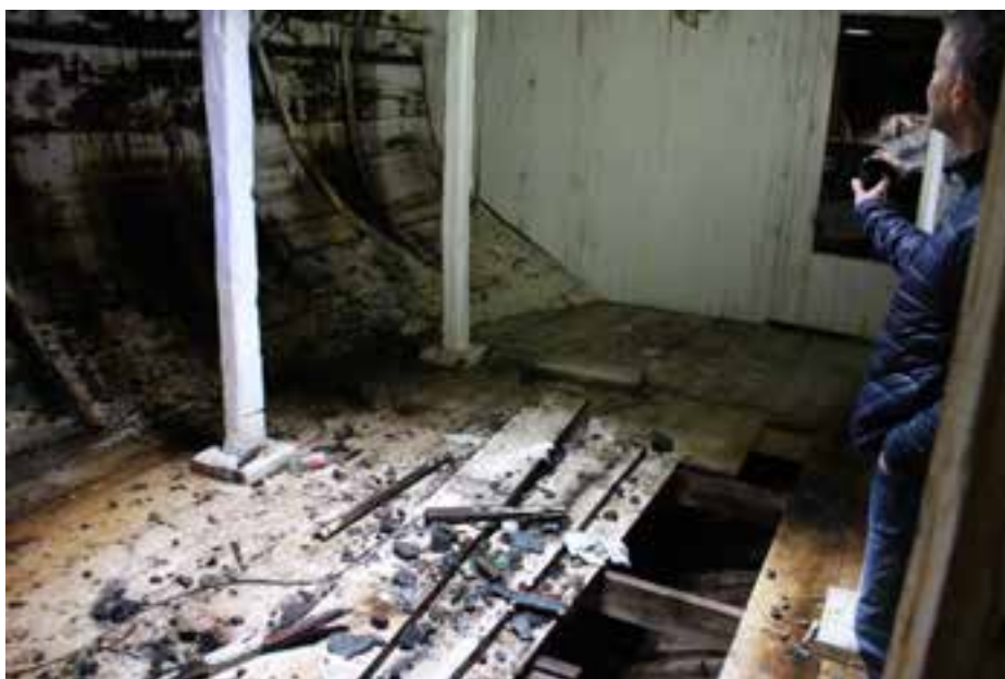
Undir þiljum í Sigurfara, 2017. Fiskilestin í miðju skipi.