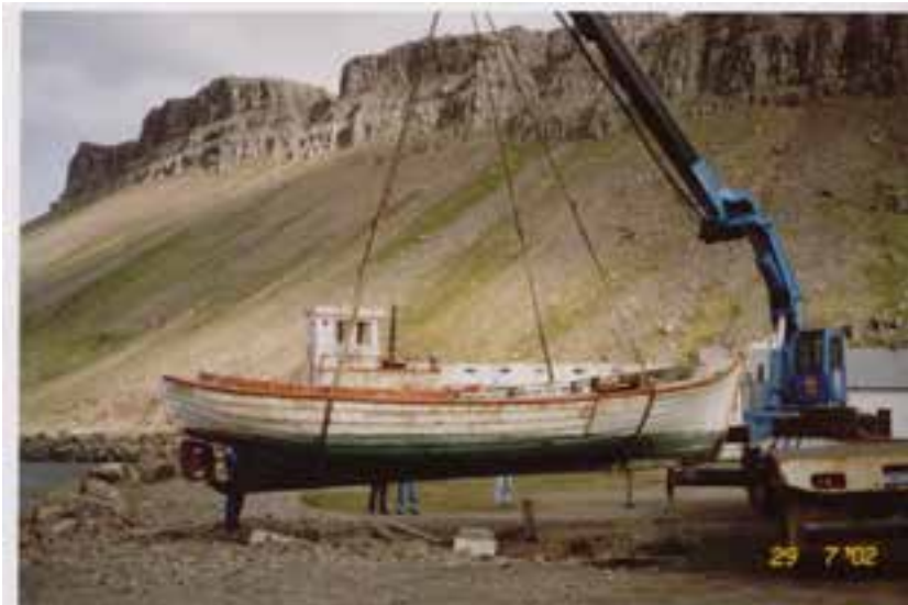
Sæljón AK 24 sótt til Djúpuvíkur, 2002.