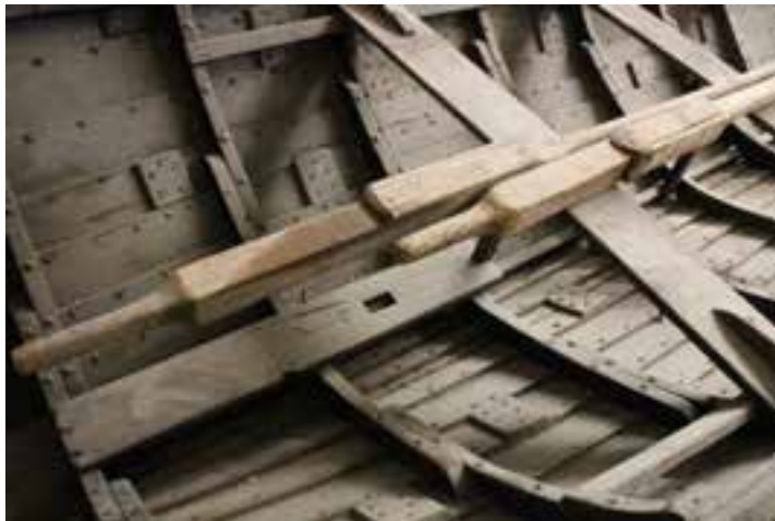
Engeyjarbátur frá Ytra-Hólmi í geymslu, 2017.

27. Almenn umsögn / varðveislumat: Vel með farinn.