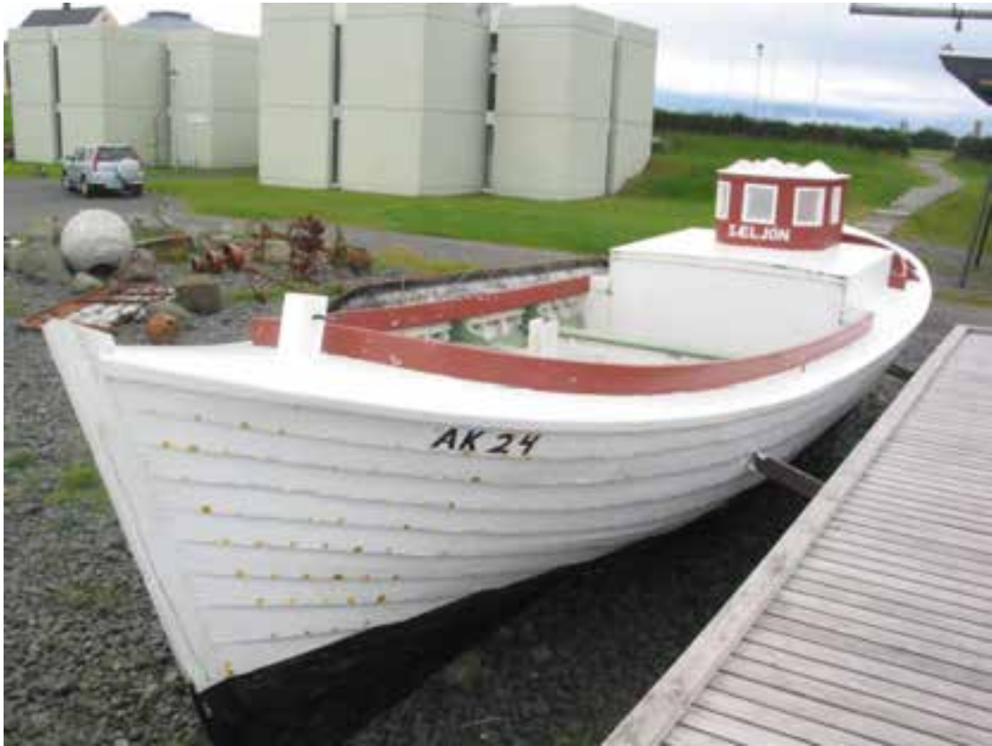
Sæljón AK 24 á safnsvæði Byggðasafnsins, 2011.