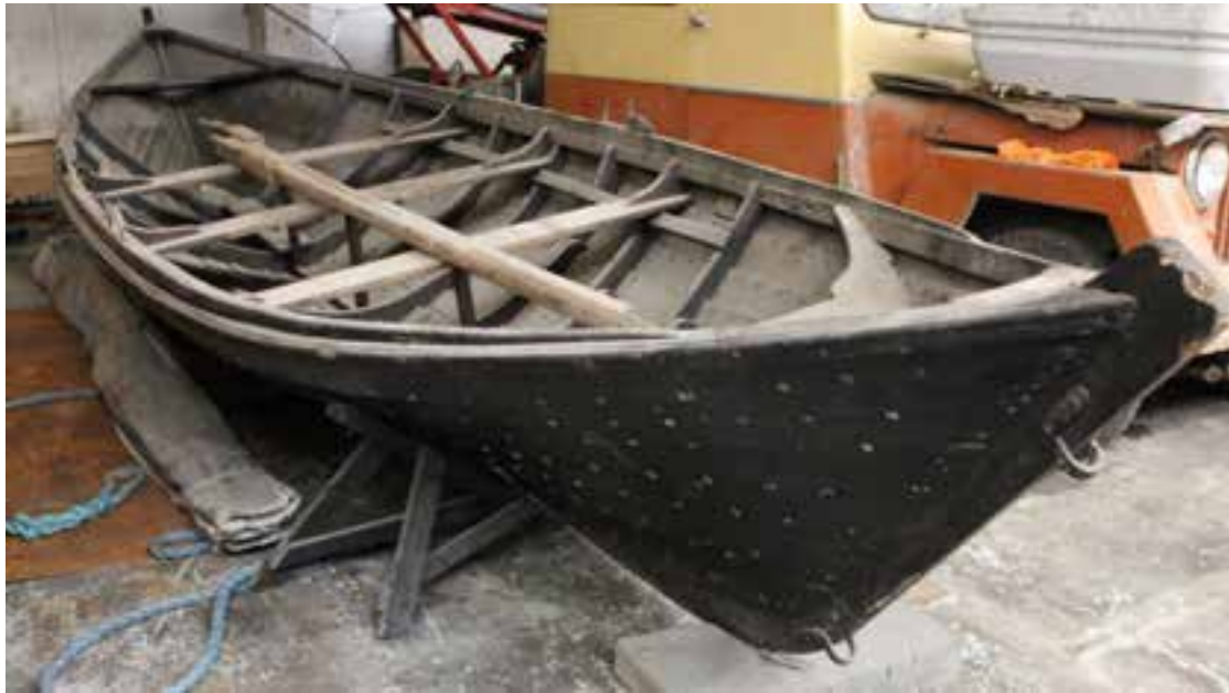
Engeyjarbátur frá Ytra-Hólmi í geymslu á vegum Akranesbæjar, 2017.