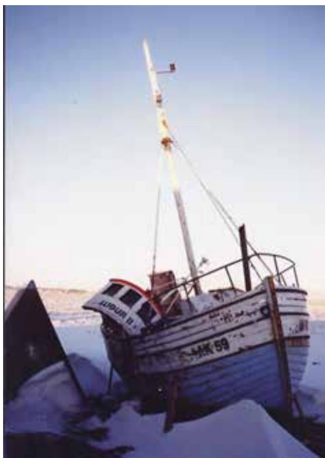
Sildin AK 88 (Auður II) árið 1995.