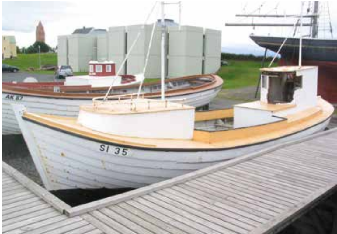
Smári SI 35 á lóð Byggðasafnsins, 2011. Einhverjir óprúttir höfðu brotið stýrishúsið.