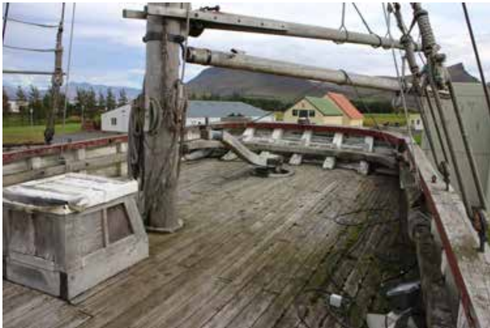
Af dekki Sigurfara, 2017. Skuturinn.