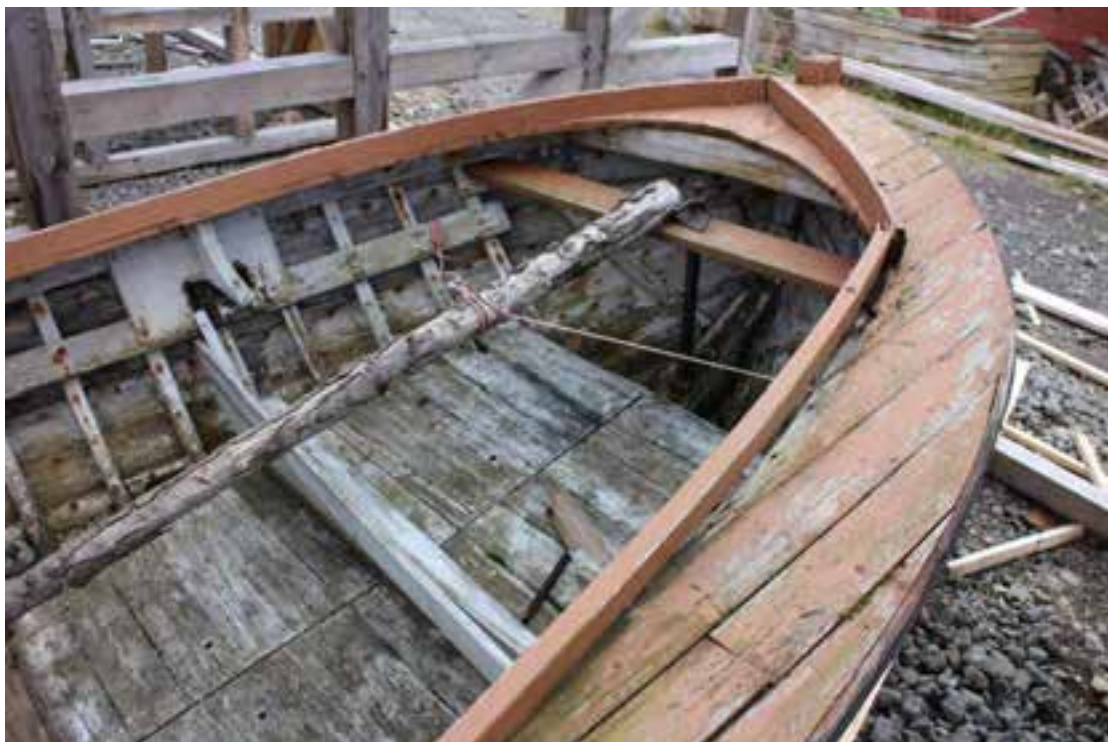
Sigursæll AK 87, skuturinn.