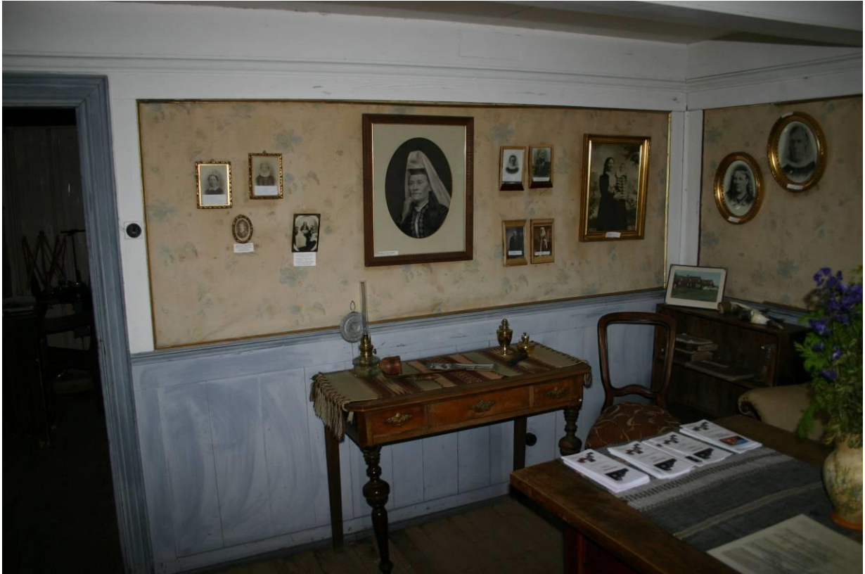
Fremri stofa. GLH 2007.