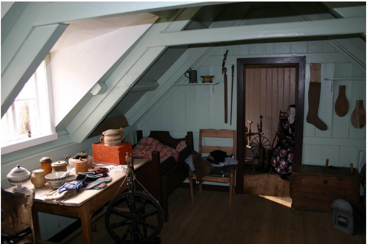
Baðstofa. GLH 2005.