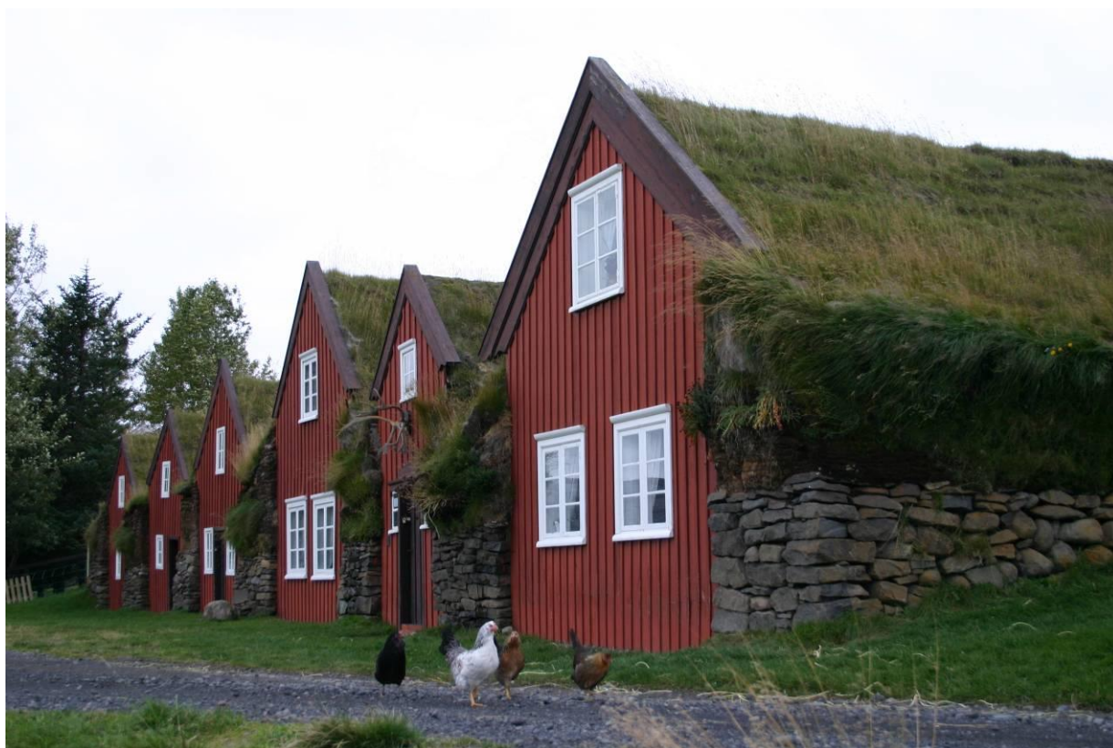
Burstarfell. GLH 2007.

Byggingarár: Um miðja 19. öld en er eldri að stofni til.