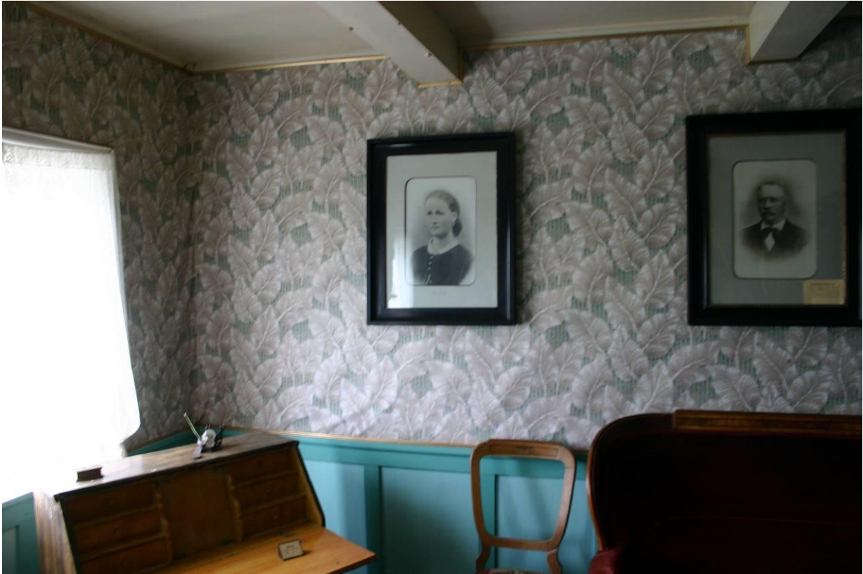
Grenjaðarstaður, Suðurstofa eða Gyllta stofa. GLH 2007.