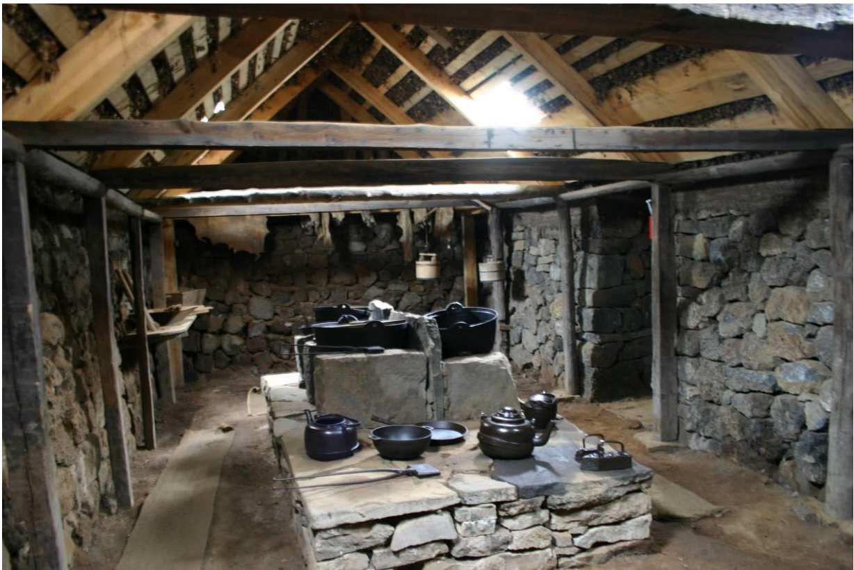
Grenjaðarstaður, blóðaeldhús. GLH 2007.