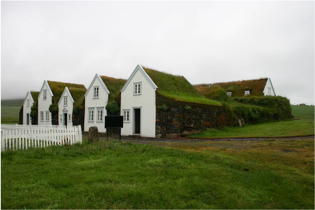
Grenjaðarstaður, blaðsýn. GLH 2007.