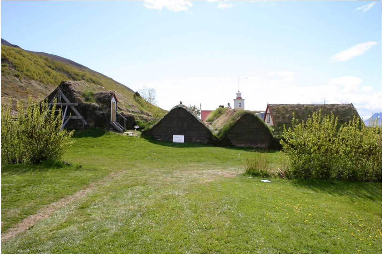
Norðurlhið, baðstofa t.v, búr, brúðarstofa og stórustofa t.h. GLH 2005.