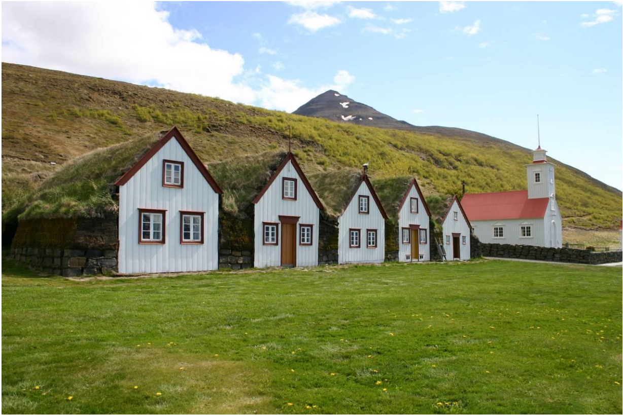
Laufás og Laufáskirkja. GLH 2005.