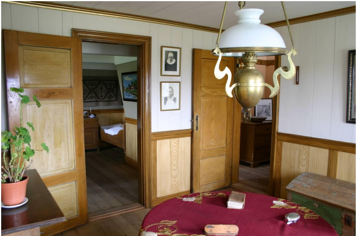
Fínastofa og gestastofa inn af henni t.v. en t.h. er gangur að bæjardyrum. GLH 2005.