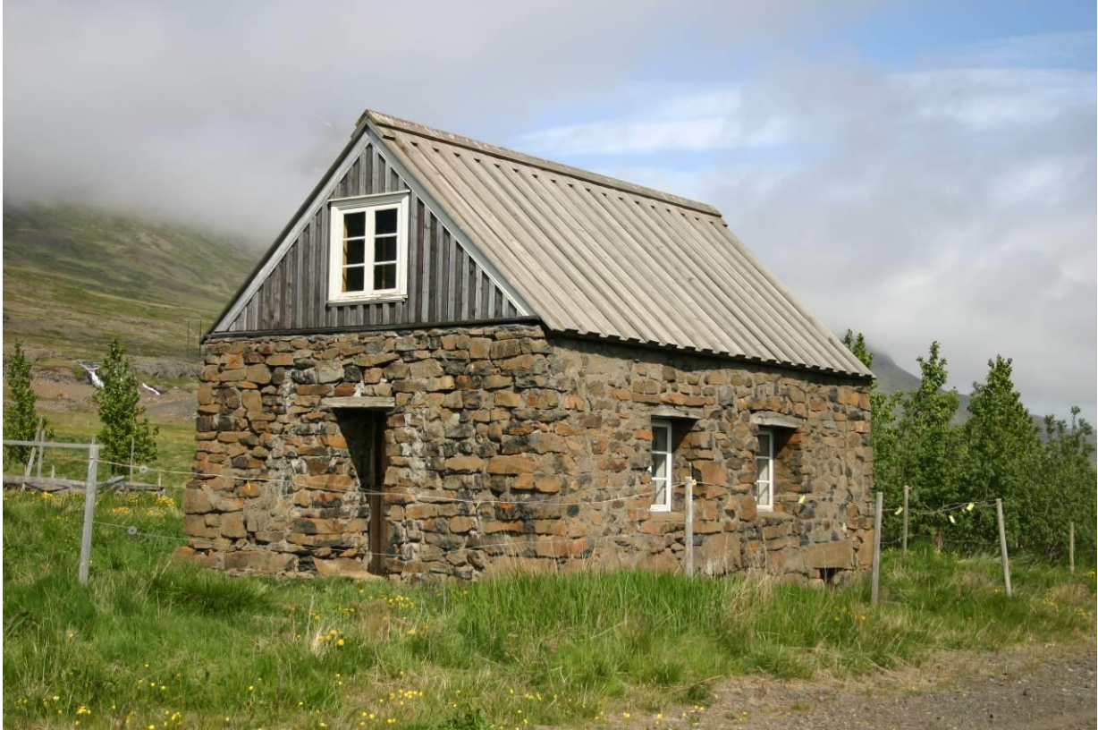
Sómastaðir. GLH 2007.