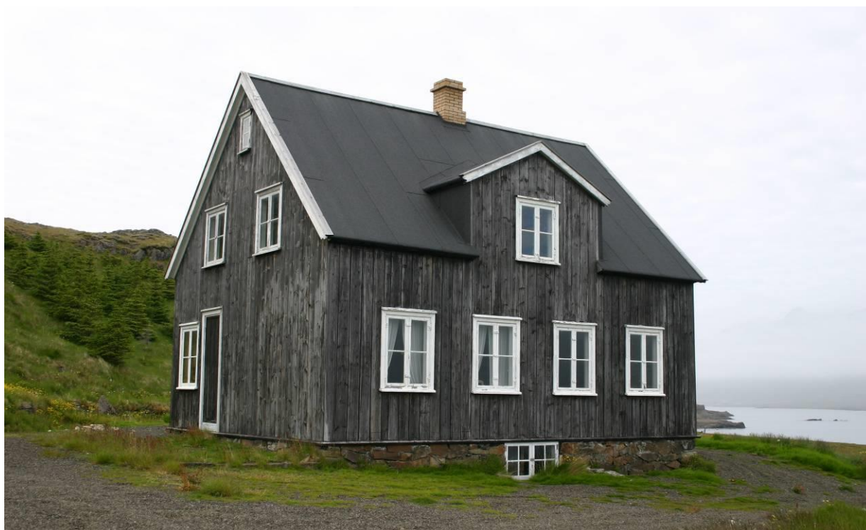
Teigarhorn. GLH 2007.