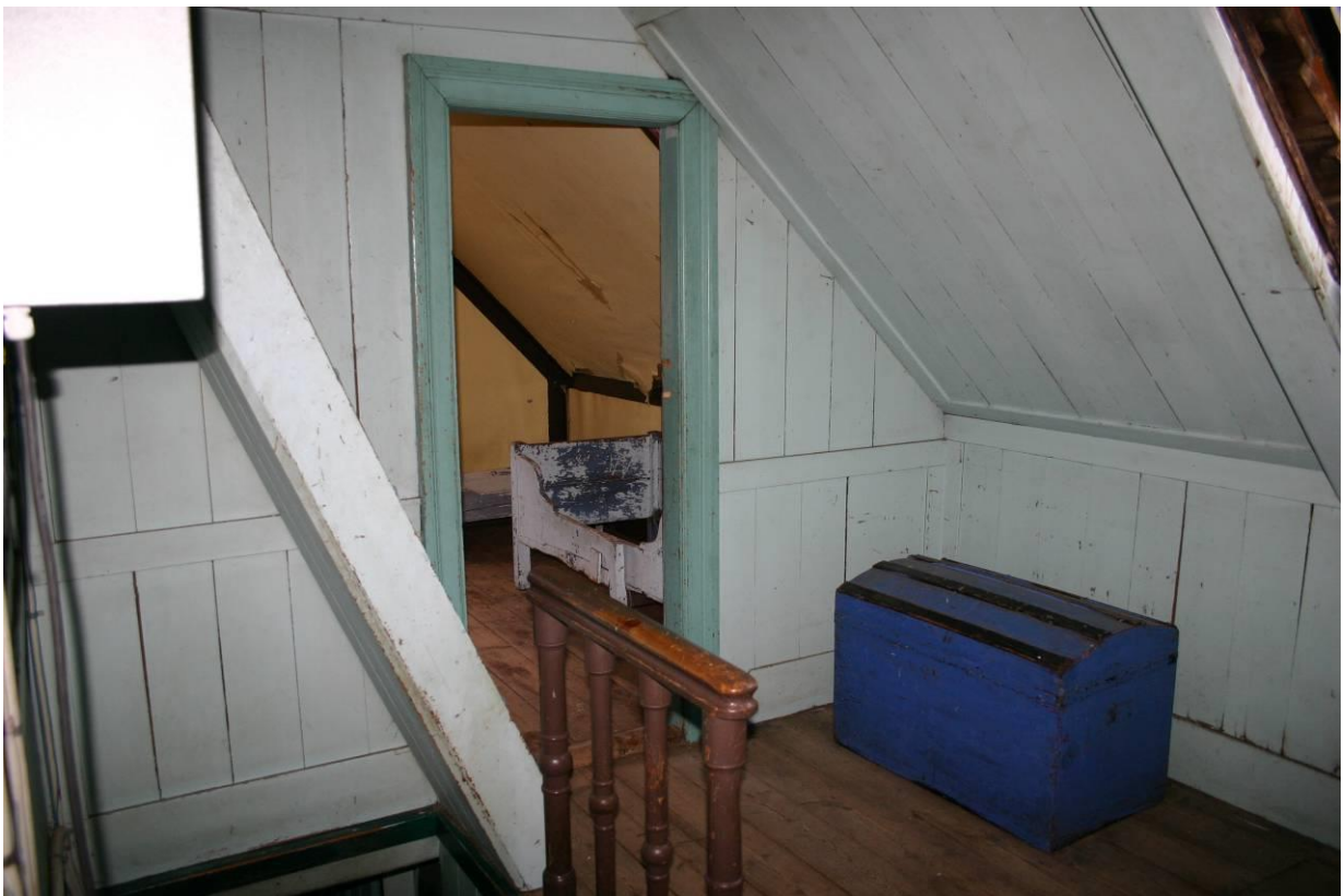
Teigarhorn, framloft. GLH 2007.