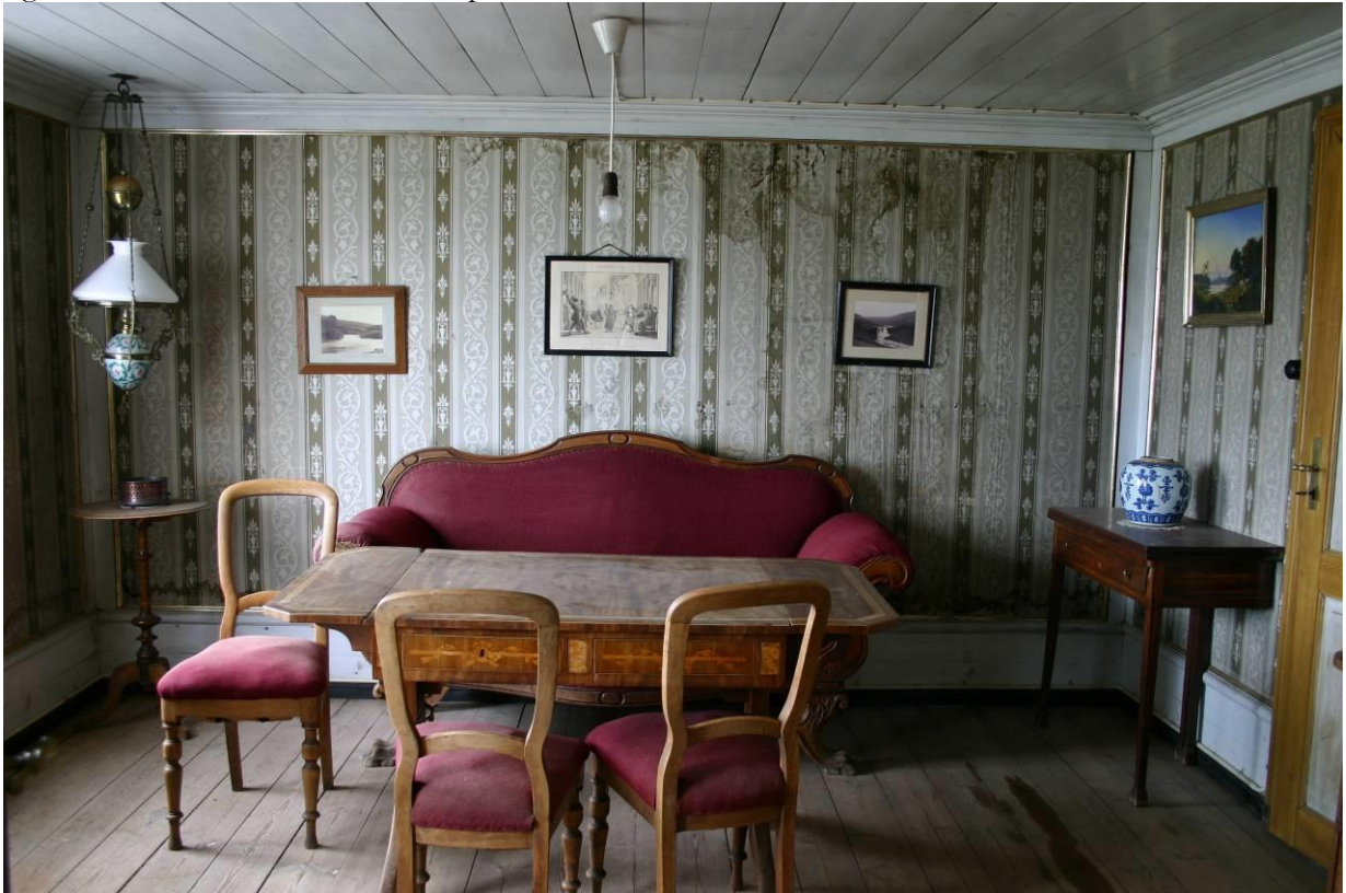
Teigarhorn, stofa með upprunalegu veggfóðri. GLH 2007.

porthæð allri eru borð á klæddum bitum. Í risi er suðurgafli veggfóðraður en norðurgafli óklæddur og súðin úr sköruðum borðum á sperrum.