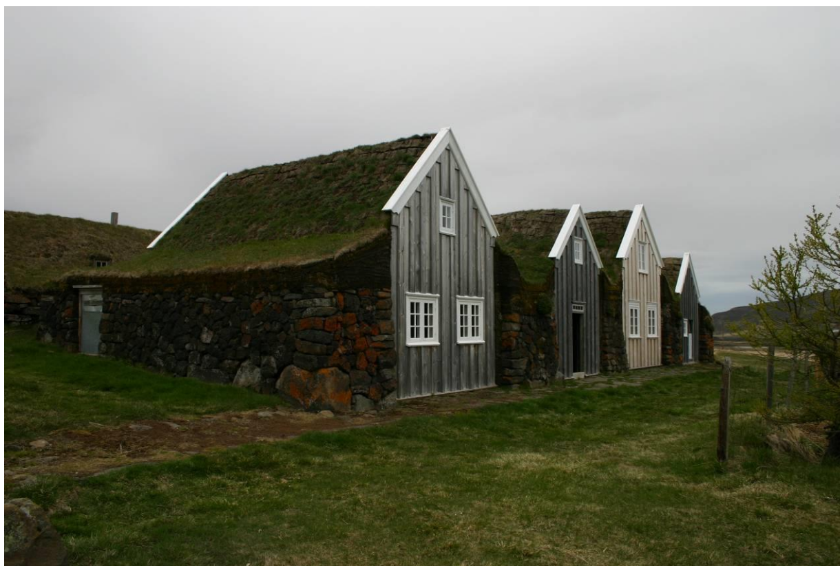
Þverá í Laxárdal. GLH 2005.