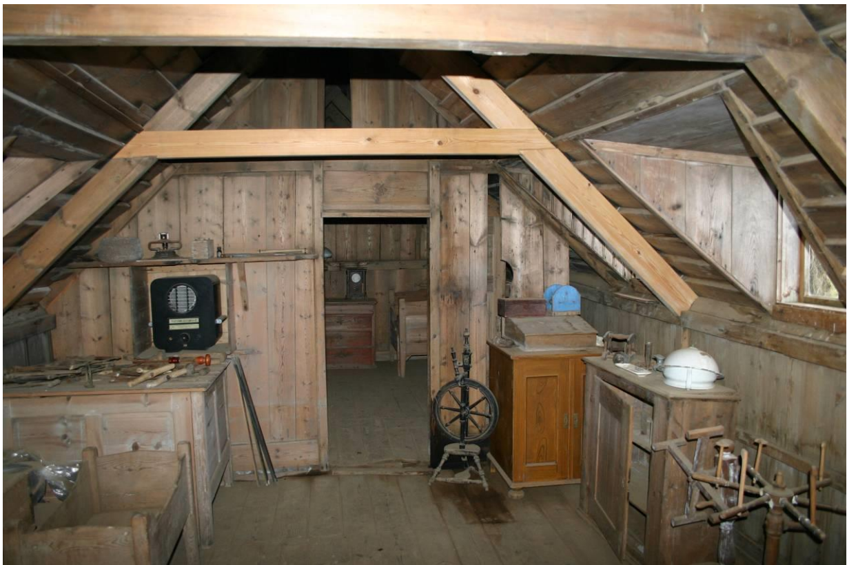
Baðstofan á Þverá. GLH 2005.