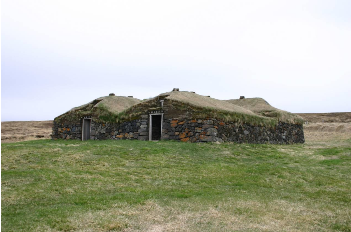
Lambhús og blaða á Þverá. GLH 2005.